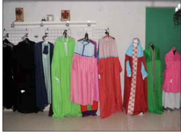
ملابس نسائية للصلاة