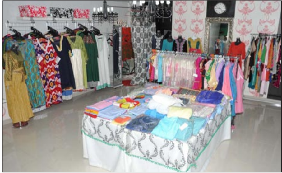
جناح الملابس والدراعات النسائية (متم غوزال)