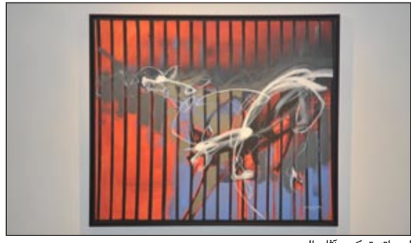
لوحاته تعكس آثار الحروب

تتمتع لؤلؤ الصباح في معرض محمد سامي في الكويت، وهو يعكس أرواح الأفراد التي مزقتها الحروب العجيبة، وشوهدت حياتها لأبد. ويروي سامي قصة تاريخ طويل من الدمار الذي تعرضت له بلاده من خلال نظرات مضطربة، ونائية بوجهها الى أرض فقرة تقيدها إيقاعات غامضة. من جهته، أبدى محمد حسين بحر العلوم سفير جمهورية العراق إعجاباً بأعمال محمد سامي قائلاً: العراق ومنذ فجر التاريخ وهو بلد الحضارات، والفنانون العراقيون هم سفراء لبلادهم أينما حلوا