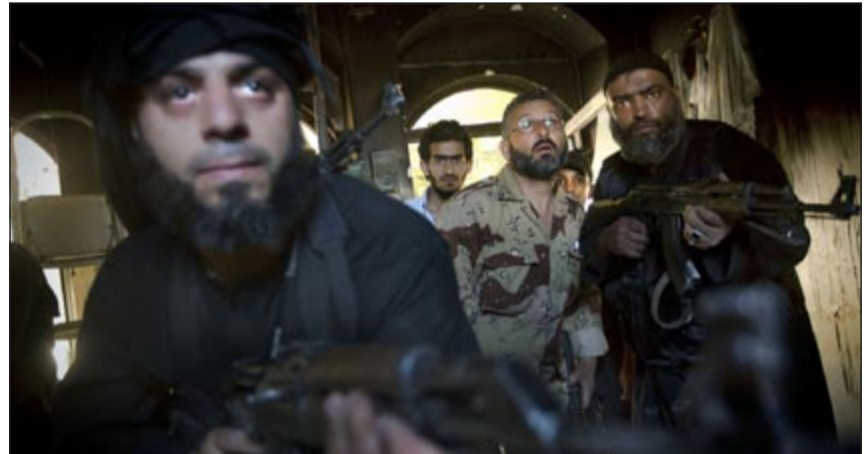
ثوار سوريون يتخذون مواقعهم في احد أماكن الاشتباكات مع قوات النظام السوري في حلب أمس الأول

على باقي الجبهات، أعلن الجيش الحر أنه تمكن من السيطرة على معسكر الشبيبة الذي كان أحد أكبر مراكز تجمع قوات النظام والشبيحة في محافظة ادلب، وبنيت «شام» صوراً للعاصفة بنقلون غنائم وخزيرة واسلحة من داخل المعسكر. لكن الطيران الحربي عاد وأغار على مدينة سمرين. وقصفت مدفعية النظام الثقيلة مدينة بنش وبلدات عين الباردة ومشمشان والكستن بريف جسر الشغور.