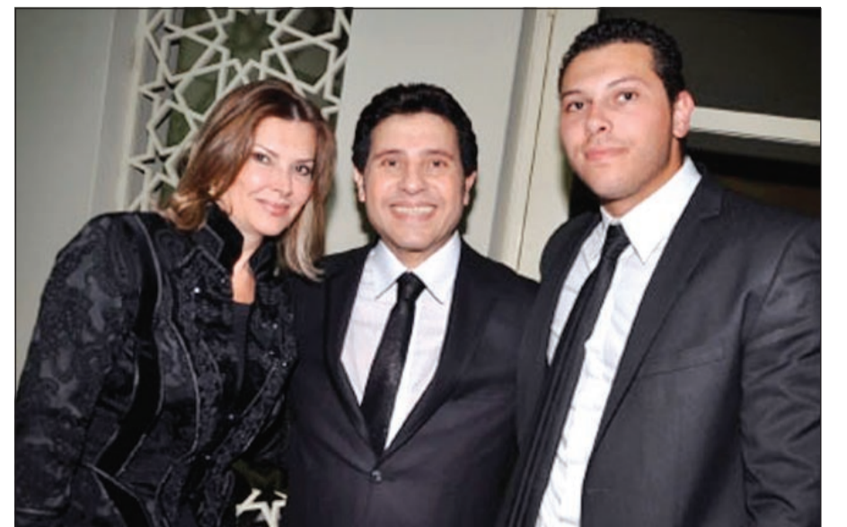
هاني شاكر يتوسط ابنه وخطيبته

بسرية تامة، احتفل هاني شاكر بخطبة ابنه شريف في أجواء عائلية اقتضرت على أهل العروسين. وأعلن النجم المصري الخبر عبر صفحته