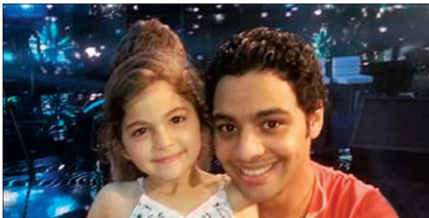
أحمد جمال مع الطفلة المعجبة به

صورة له برفقتها وعلق عليها مازحا: «خطيبتي أعجابتني بتجوز». معجبات أحمد جمال انهلن بالتعليقات الممازحة له على الصورة ومن أبرزها، «دا أنا أموتك.. محدش هيتجوزك غيري»، «طب امتي الفرح بقى»، و«تتربنى في عرك»، «هي البنيت قمورة بسم الله ما شاء الله بس انت بردوا مش هتتجوز»، «أمال أنا أبقي ايه بلاش كدا أصل تزعل مني والله أموتك يا أحمد».