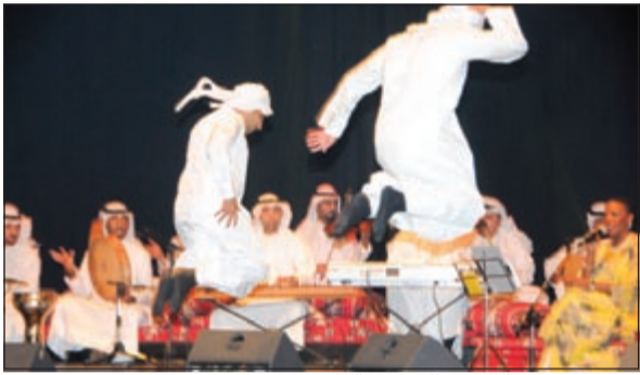
رقص شعبي تفاعل معه الجمهور الغفير

فطومة اختارت أغنية «آه يا ويلي منه» وهي من إيقاع «الطمبورة» من أعمالها الغنائية الجميلة التي تميزت بمسيرتها الفنية الطويلة.