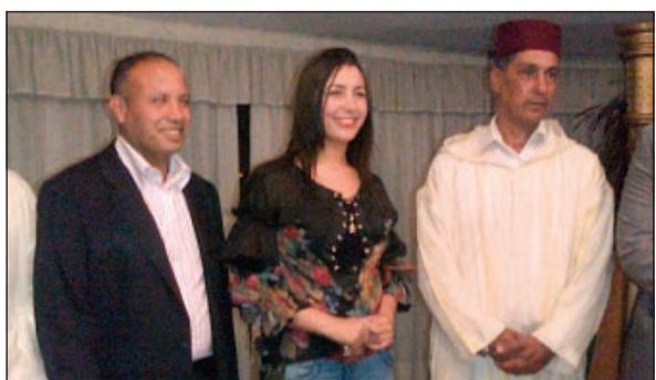
جنات من الاحتفال

نظم قبل ايام الاتحاد المصري للإعلام والثقافة الرياضية بأحد الفنادق بمصر الجديدة، حفل عشاء فاخرا على شرف الجمعية المحمدية للصحافة والأعلام المغربية التي يتواجد حاليا أعضاءها في زياره تستغرق أسبوعا بمصر، وخلال الحفل تم الاحتفال بالمطربة المغربية جنات وبالبومها «حب جامد»، كما الذي لقي نجاحا كبيرا، كما تم منحها عضوية فخريه من قبل رئيس الجمعية المحمدية للصحافة والأعلام المغربية في حفل حضره عدد كبير من الشخصيات الفنية والإعلامية البارزة. جنات عبرت عن شكرها من هذا التكريم، خصوصا انه جاء من إعلام بلدها الذي دائما ما يساندنها في كل خطواتها، سواء في المغرب أو خارجها، وكذلك الإعلام المصري الذي تبناها منذ