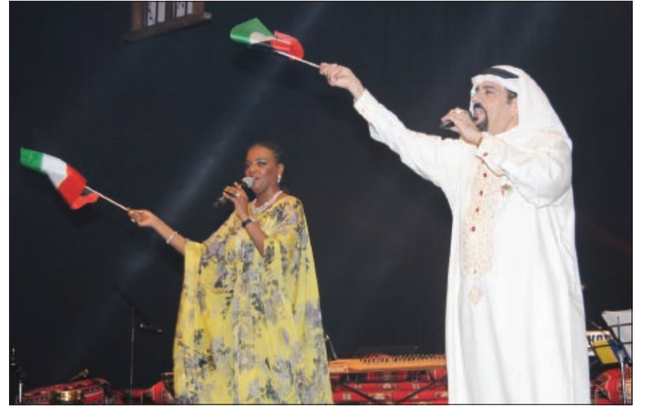
القصار وفطومة وشيلات وطنية بحب الكويت وآل الصباح

في اليوم الثالث لـ «الموسيقى الدولي» الـ 16 وعلى خشبة «الدسمة»