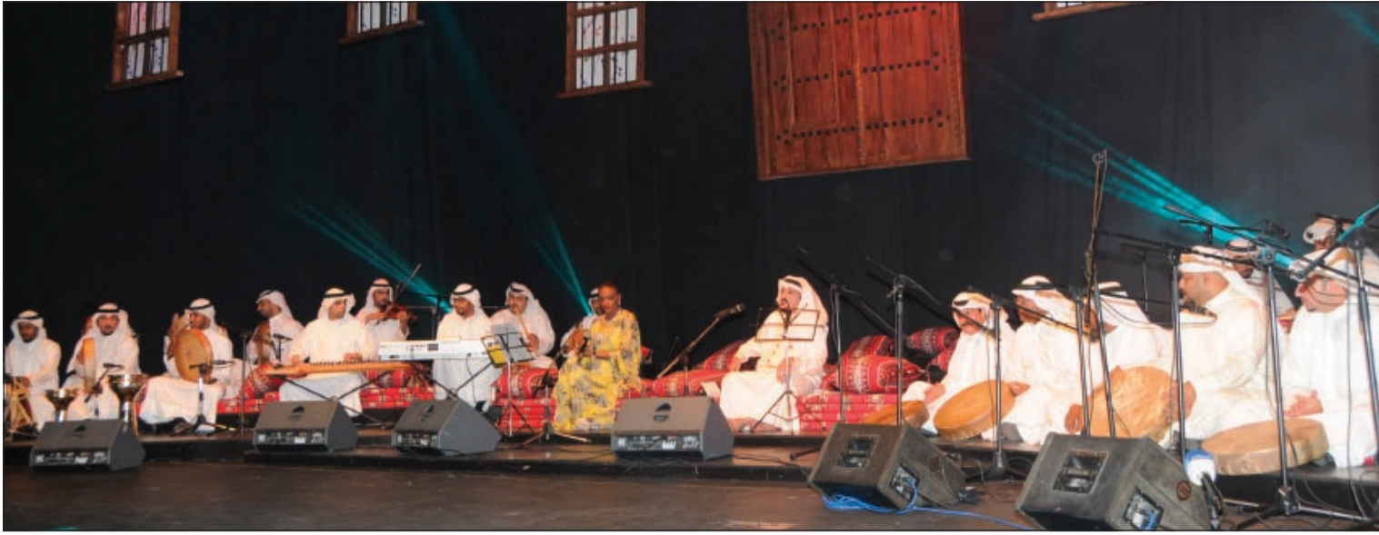
جلسة غنائية تراثية مميزة ومفعمة بالأحاسيس