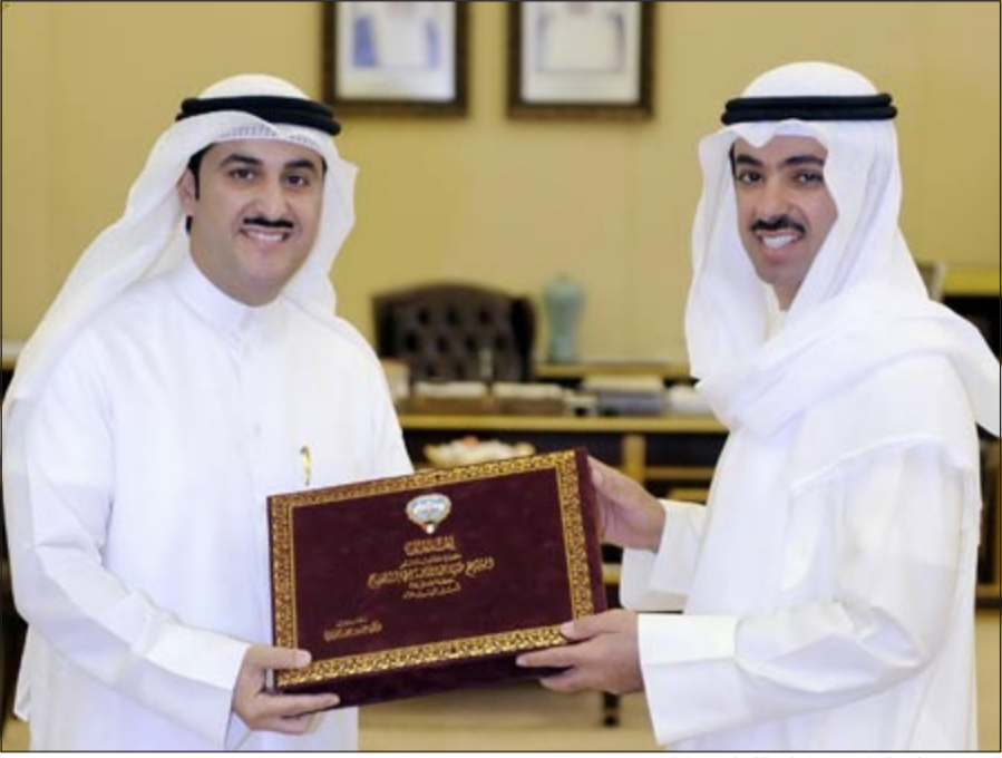
الرئيس علي الراشد يتسلم الكتاب من العميري

صاحب السمو الأمير حتى وصوله سدة الحكم، كما اهداه كتاباً آخر بعنوان «عهد الولاية الوفية» ويحكي الكتاب عن مسيرة سمو ولي العهد حتى وصوله لولاية العهد.