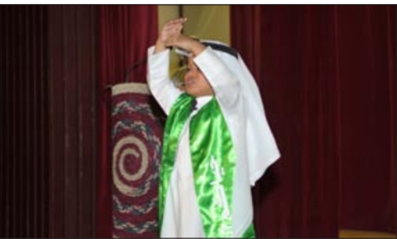
أحد الطلبة يلقي كلمة ترحيبية