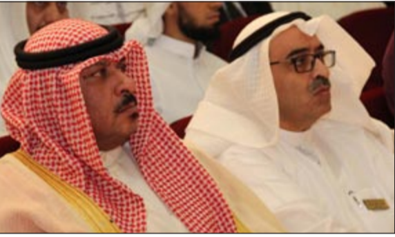
الشيخ طلال الخالد في مقدمة الحضور

خرج الملتقى التربوي الخامس لمجلس مديري المرحلة الثانوية لمنطقة العاصمة 5 توصيات لتطوير العملية التعليمية. أقيم الملتقى تحت عنوان «التعليم أداء وهدف» في مكتبة البابطين تحت رعاية العضو المنتدب للعلاقات الحكومية البرلمانية والعلاقات العامة والإعلان بمؤسسة البترول الشيخ طلال الخالد والمدير العام لمنطقة العاصمة التعليمية بسرى العمر، ومرافق التعليم الثانوي عادل الشاش. وكانت هناك شفافية في النقاش والشرح وكانت هناك جرأة من الطلبة في عرض ما بداخلهم من أفكار ومفاهيم تخص حياتهم الدراسية ومستقبلهم العلمي وكان هناك لديهم بعد نظر في تحديد الهدف من دراستهم وطموحهم ومستقبلهم العلمي والوصول لأعلى المراتب العلمية وقد كان هناك الكثير من المصاحبة بين قيايدي التربية والحضور وطرح وجهات النظر وقد كان هناك استحسان من الجمهور لهذه الرؤية الطلابية ومشاركة أولياء الأمور بالحضور والاستماع لأبنائهم الطلبة والطالبات، وخرج الملتقى بالتوصيات التالية: أولا: التغيير والتخطيط: وإن كان ليس بهدف وإنما أسلوب وطريقة تهدف إلى التطوير والبناء، لذا يجب أن يكون التغيير باتجاه التطوير وليس التغيير بهدف التغيير وما ينطبق على التخطيط فهو ليس هدفا وإنما آلية لتحقيق الأهداف والبرامج التي تسعى إلى التطوير.