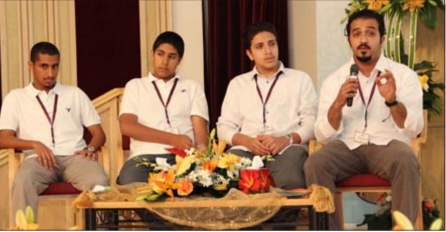
عدد من الطلبة يطرحون وجهات نظرهم