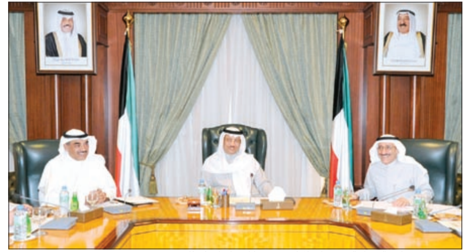
سمو رئيس مجلس الوزراء الشيخ جابر المبارك مترنسا اجتماع الاعلى للبترول

عقد عمومية غير عادية لبحث تعديلات النظام الأساسي للشركات النفطية