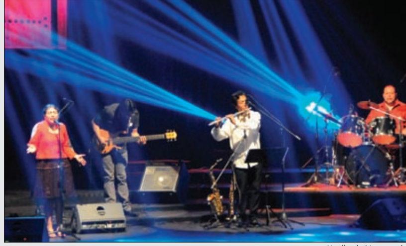
جانب من فقرات الحفل