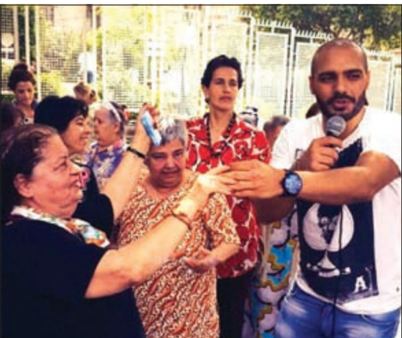
جوزيف ورقصة مع المسنين

في لفته إنسانية منه قرر المطرب اللبناني جوزيف عطية تخصيص يوم كامل ليقتضيه في «دير الرحمة» للمسنين. جوزيف نجح في رسم البسمة على وجوه المسنين الذين تفاعلوا مع نجم ستار أكاديمي بالرقص والغناء، وقد نشر الفنان الشاب مجموعة من صور الزيارة على حسابه الرسمي بموقع تويتر.