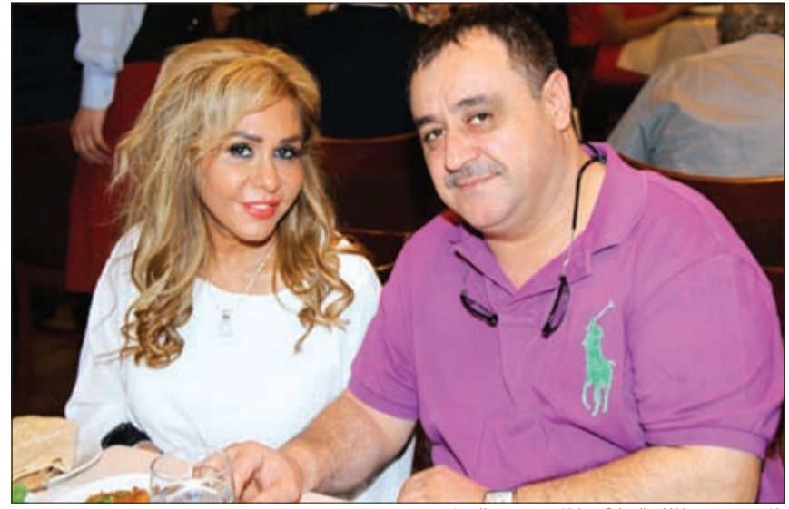
المخرج مؤمن الملا والفنانة مها المصري في الحفل

التي تعمل المستحيل في شتى الظروف لإبقاء الدراما السورية في خط سيرها المعهود.