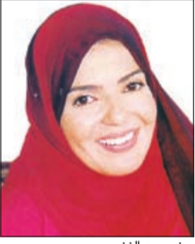
منى عبد الغني

عن واحدة كان عارفها.. ماركتش معاه وحاولت ماسمعوش وقعدت في ركن «بعد». يذكر أن منى تعود للغناء بعد توقف دام لأكثر من 15 عاماً عقب ارتدادها الحجاب.