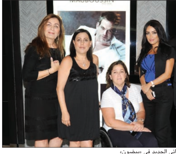
فريق العمل أثناء اطلاق عطر جورجيو أرماني الجديد في «بيضون»