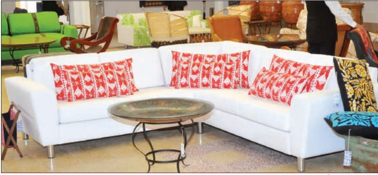
من المنتجات المعروضة