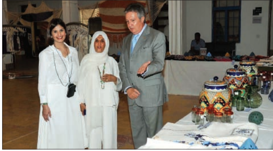
السفير المكسيكي لويس البيرتو يتحدث إلى سعاد ولولوة السايير