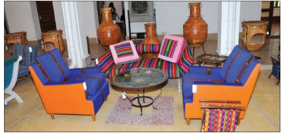
اثاث بالوان رائعة