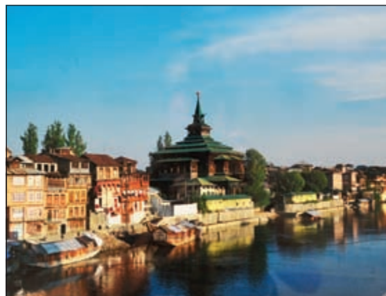
مناظر جذابة تترك أثرا جميلا في العين

تخلعت سفارة جمهورية الهند بالتعاون مع المجلس الوطني للثقافة والفنون والآداب معرضا للصور الفوتوغرافية حول الآثار الإسلامية في الهند للمؤرخ الفني والمصور بينوى ك. بهل. افتتح المعرض السفير الهندي ساتيش شاندي ميهتا والأمين المساعد لقطاع المسارح والفنون محمد المسعودي وحضره عدد من السفراء وزوجاتهم ومجموعة من الفنانين التشكيليين، وكذلك حضره أول سفير للمكويت في مومباي السفير الأسبق عيسى عبدالرحمن العيسى، وقصص الكويت في مومباي فيصل العيسى، اشتمل