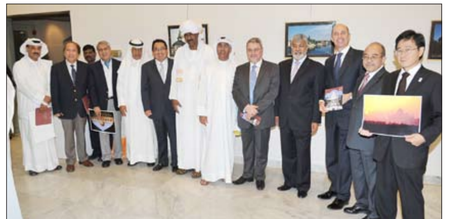
صورة جماعية للسفراء الحاضرين مع المصور الفنان