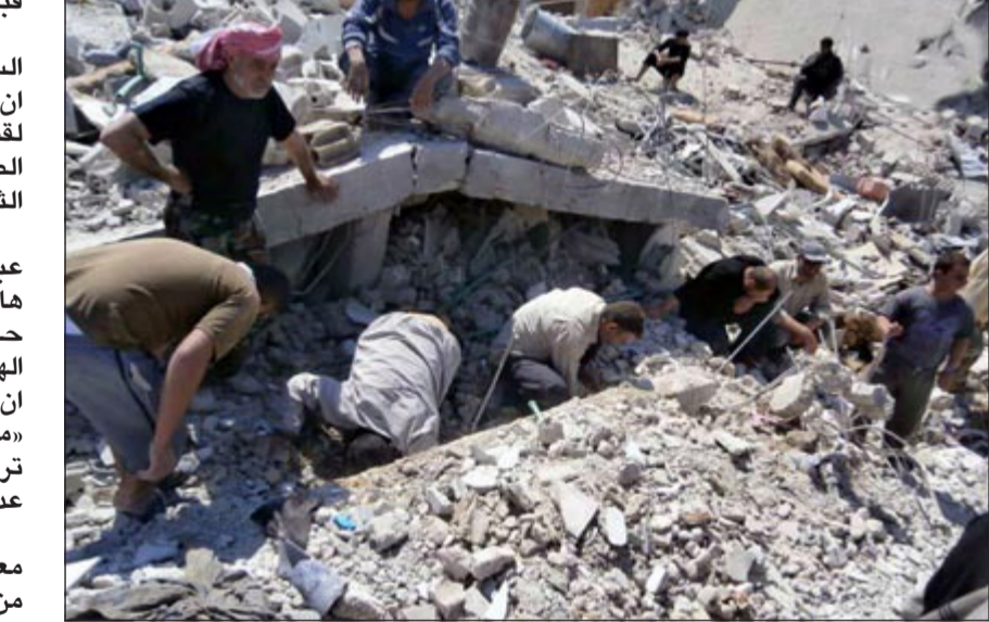
صورة عن «عسة القصير» لمدينين يحيون عن ناجين تحت انقاض منازل مرمتها غارات النظام في القصير امس

موري قال ان هجوم الجيش السوري وحزب الله لم ينجح. وتقول مصادر المعارضة ان مقاتلي المعارضة جهزوا دفاعاتهم منذ أشهر وقاموا بوضع شرك خداعية والغام وقنابل على جوانب الطرق لمواجهة الهجمات المدرعة وسيارات حزب الله الجيب. وقال المرصد السوري لحقوق الانسان ان ثلاثة من مقاتلي حزب الله توفوا متأثرين بجروح أصيبوا بها في القتال العنيف الذي وقع في القصير يوم الأحد ليصل عدد قتلى حزب الله هناك الى 31، فيما أوردت مصادر لبنانية أسماء 40 من مقاتلي الحزب قتلوا في القصير من الجنوب والبقاع إضافة الى نحو 100 جريح، وعرضت قناة «المنار» التلفزيونية التابعة لحزب الله لقطات لتشجيع خمسة عناصر من الحزب امس في لبنان، مشيرة الى