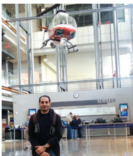
طائرة هليكوبتر أخبار معلقة في سقف المتحف من الداخل