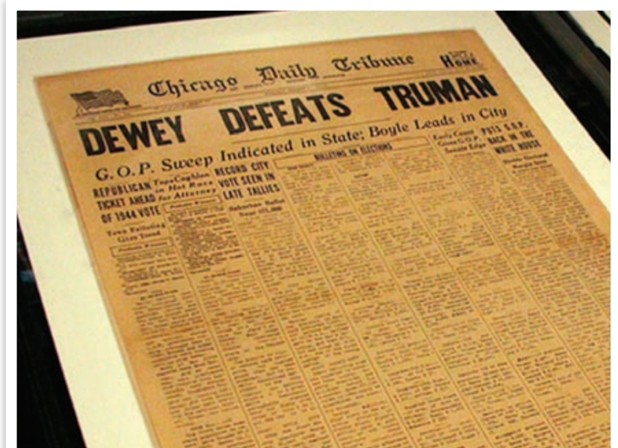
شيكاغو ديلي تريبيون تعلن فوز دوي بالخطا