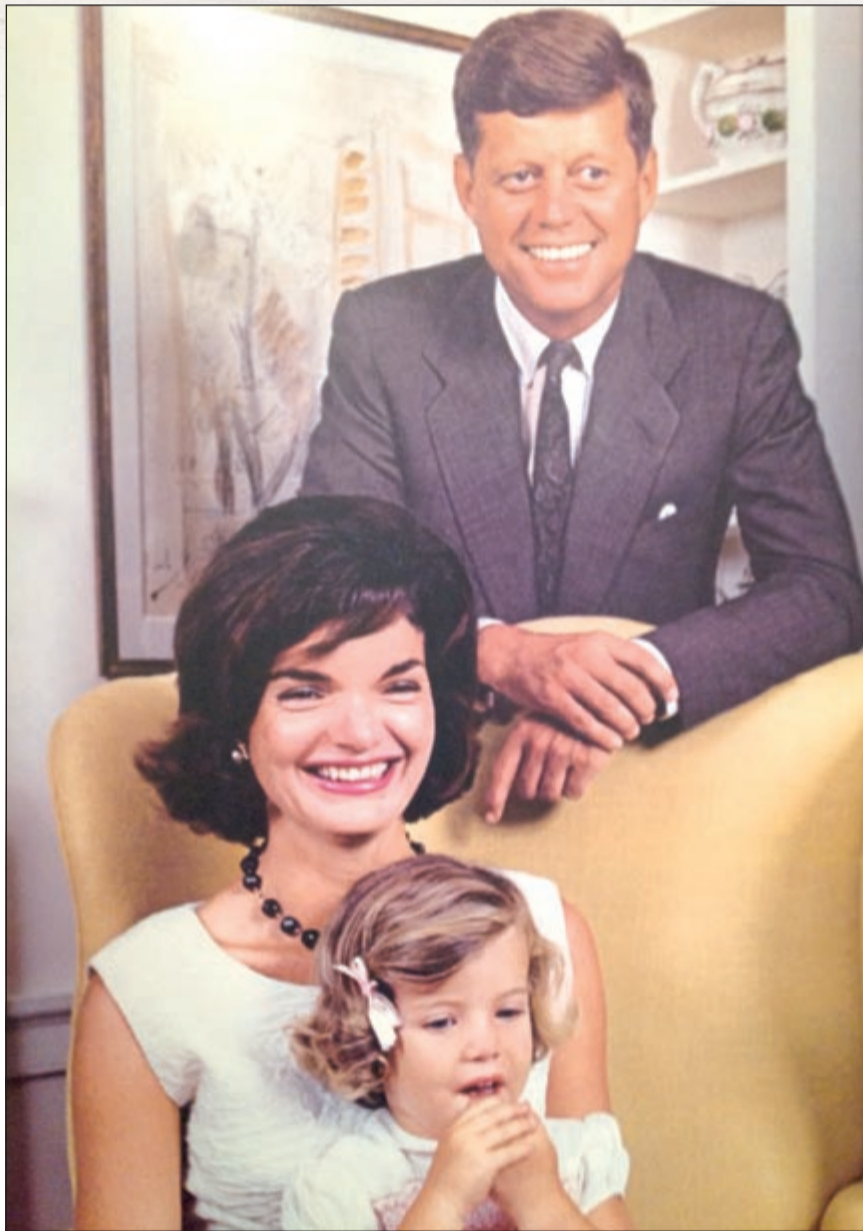
صورة للرئيس الأميركي الراحل جون كينيدي وزوجته جاكين وابنتها في صورة تتصدر قاعة الاحتفاء به

في مركز الهدايا الواقع بداخل المركز يمكنك أن تشتري كل شيء يتعلق بما شاهدته بالمعرض تقريبا، فمسن أزرار حملة جون كينيدي الانتخابية مروراً بمرمون وشعارات الحزبين الجمهوري والديموقراطي وانتهاء بطابع خاص لمارتن لوثر كينغ.