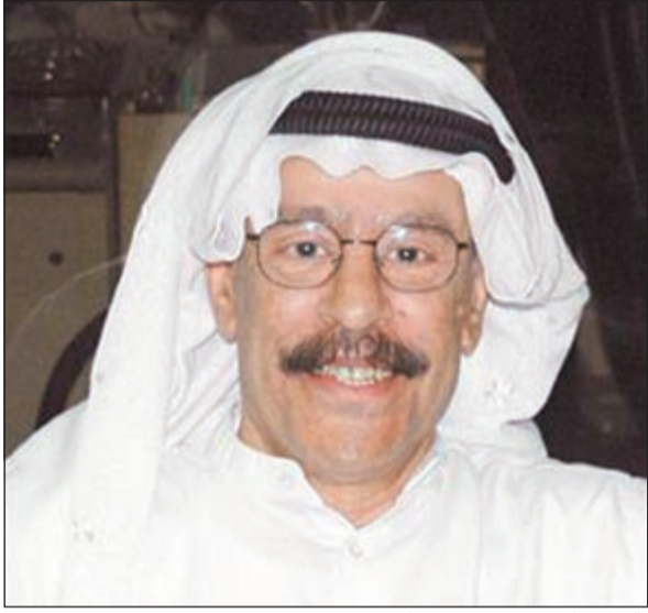
الشاعر المخضرم بدر بورسلي