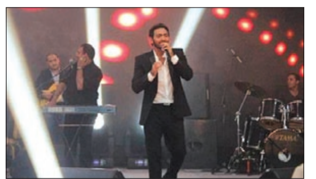
تامر حسني في حفله بقطر

في بداية الجولة الغنائية التي سيقوم بها في أكثر من بلد أحيا الفنان المصري