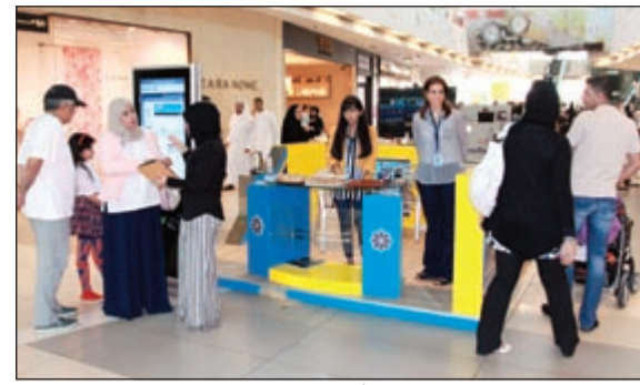
فريق عمل الهيئة يشرح لرواد الأقنيوز برنامج «كويت فايندر»

كالمطاعم وامكان التسوق والترفيه وخدمات الصحة والتعليم والمساجد، والجهات الحكومية والخدمية وغيرها من العناوين التي يمكن الاستدلال عليها بواسطة البرنامج، وبيان خيارات البحث لتبسيط وتسهيل الوصول اليها، من خلال ادخال الرقم الآلي للعنوان