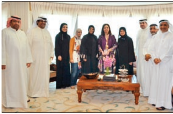
د.رولا دشتي مستقبلة د.عبدالله سهر ووفد إدارة الإحصاء

والاستمرار في التميز. وقالت د. دشتي: أهني موظفي الإدارة المركزية للإحصاء على تقدمهم