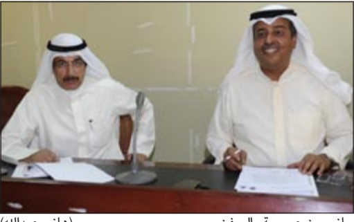
جانب من عمومية «السفن»

قال رئيس مجلس إدارة شركة الصناعات الهندسية الثقيلة وبناء السفن جحيل الجحيل إن الشركة تتجه في 2013 للتوسع في السوق العراقي، لافتاً الى ان الشركة أسست فرعاً لها بالعراق. وأضاف الجحيل على هامش اجتماع الجمعية العمومية للشركة أمس للجنة المالية المنتهية في ديسمبر 2012 ونسبة حضور بلغت 80,9% ان الشركة تقوم حالياً بوضع دراسات عديدة للوصول إلى زيادة الإيرادات في الأعوام المقبلة وتحقيق أعلى ربحية للهيكل بالشركة إلى النجاحات المستمرة والذي يسعود اثره على المساهمين. وبين ان الشركة تعتمد في عملها على المشاريع التي تطرح من قبل الدولة سواء كانت مشاريع نفطية او غيرها ونظراً لأن الشركة متخصصة في مجالات معينة غير متوفرة في الشركات المنافسة، فإنها تحصل على نصيب جيد من هذه المشاريع، مؤكداً أن تأخير مشاريع الدولة ينعكس سلباً على أداء الشركة.