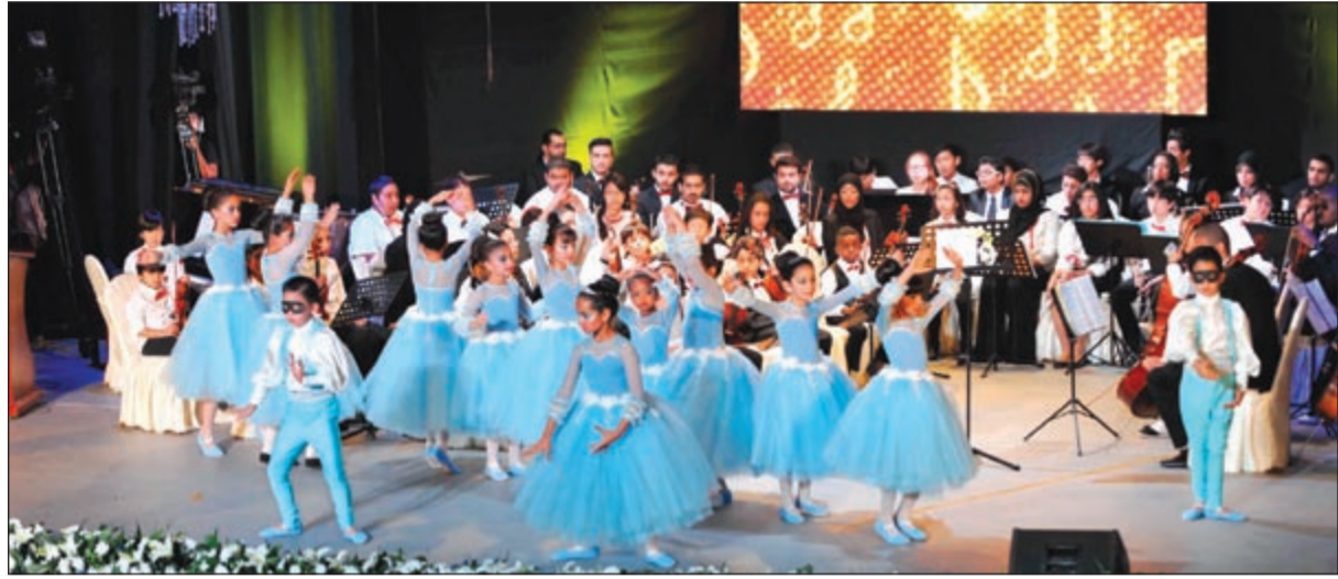
مجموعة من الأطفال أثناء فقرة الباليه

وجاءت فقرة الختام مع أوبريت رائع قدمته فتيات البالية في حب الكويت تمايل معه الجمهور وشارك الأطفال الغناء، الأمر الذي دعا د.الهباد إلى إعادة الأوبريت مرة أخرى بعد تحية الأطفال للجمهور، لتكون ليلة غنائية ناجحة ومبشرة بحيل متميز يتطلع إلى نجاح آخر على طريق جميع اشكالها.