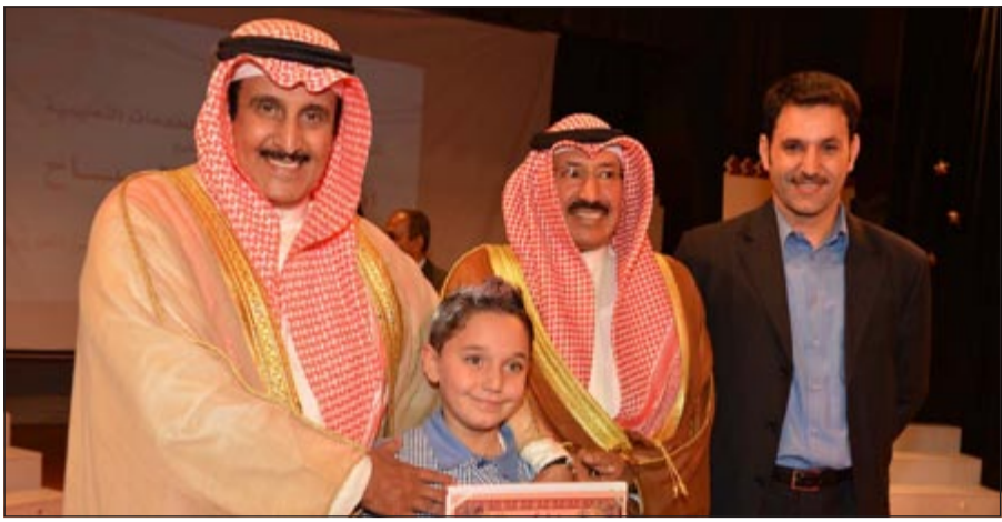
الشيخ د. إبراهيم الدعيح يكرم إحدى الفائزات