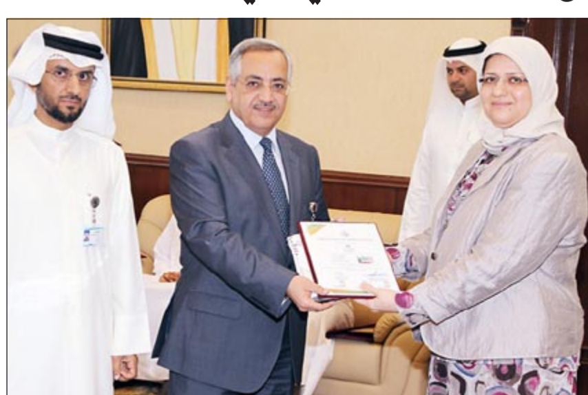
جانب من رعاية «التجاري»

على توطيد أواصر التعاون بينه وبين الهيئة العامة للتعليم التطبيقي من خلال التواجد في المعارض الوظيفية المختلفة للهيئة لاستقطاب خريجيه للعمل بالبنك، معربة عن سعادتها الغامرة بحصول الطلبة الكويتيين المشاركين على مراكز متقدمة في هذه المسابقة.