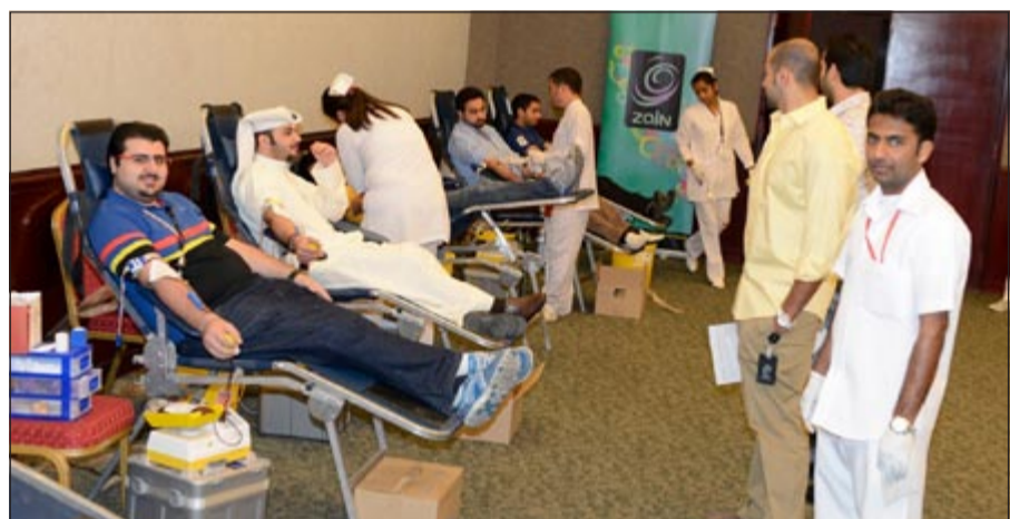
جانب من حملة التبرع بالدم لموظفي «زين»

في عالم البنوك والمؤسسات المالية كونها تعتبر واحدة من أكبر 3 مؤسسات عالمية مشهود لها بالمصداقية العالية لأنها تقوم باختيار الأفضل بناءً على معايير صارمة وتقارير معتمدة.