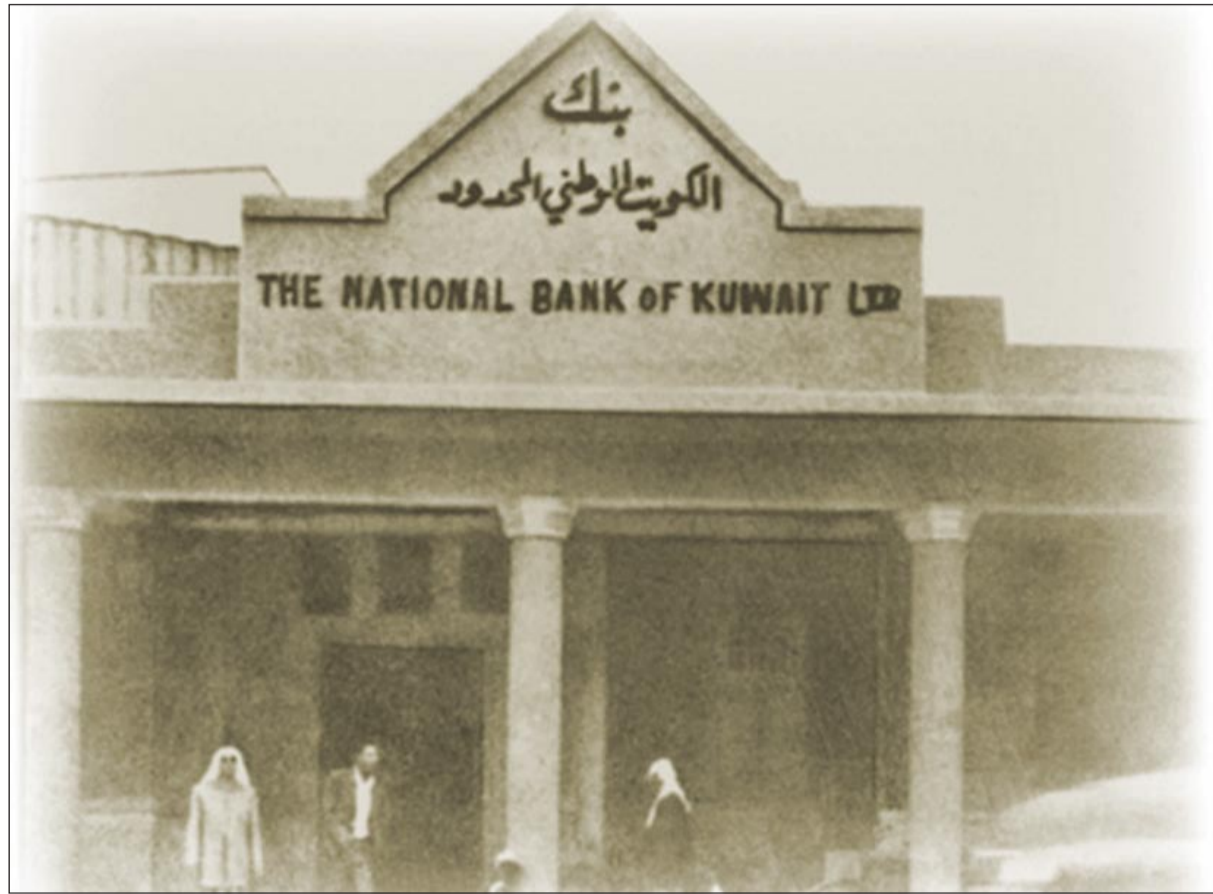
المقر الأول في الشارع الجديد