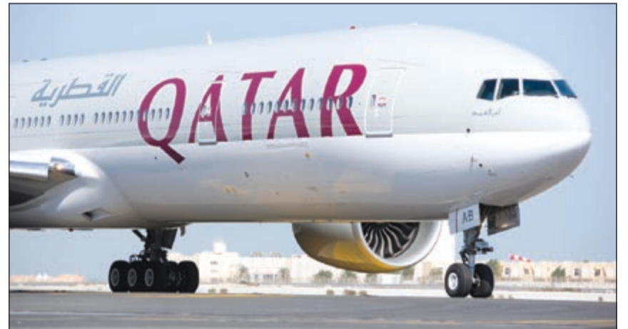
إحدى طائرات الخطوط الجوية القطرية

المشترك سيعطي مسافرينا حرية التنقل بين وجهات أكثر في تايلند، التي تعد من أهم محطاتنا في آسيا.» وتشغل الخطوط الجوية القطرية حالياً أربع رحلات مباشرة أسبوعياً إلى بانكوك كما تسير رحلات إلى بوكيت من الدوحة يومياً، إضافة إلى رحلات يومية إلى كل من بنوم بنه ويانغون. من جهته، قال نائب أول رئيس شبكة الخطوط الجوية التايلندية بيتر وايسنر: «ستتيح هذه الاتفاقية أفضل الرحلات لمسافري الرحلات طويلة المدى على الخطوط الجوية القطرية إلى بانكوك ومنها إلى رحلاتهم داخل تايلند أو إلى كمبوديا وميانمار. كما ستكون السائحون من الوصول للوجهات الأكثر شعبية مثل سومي وبوكيت وشيانغ ماي مما سيؤثر إيجابياً على نمو السياحة في تايلند وآسيا عموماً، وتعتبر الخطوط الجوية القطرية واحدة من أسرع شركات الطيران نمواً في العالم، فقد شهدت نمواً سريعاً وملحوظاً على مدار 16