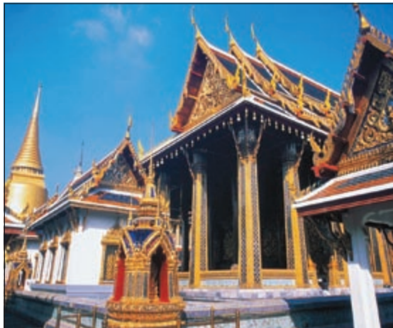
القطرية ترفع رحلاتها إلى تايلند