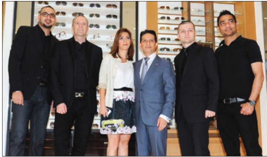
لقطة تذكارية مع فريق العمل

للنزهات، كما لا يمكنه ممارسة رياضة الجري بحذاء ذي كعب عال على سبيل المثال. آيوتيك يتخطى الأسلوب التقليدي في الخدمة البصرية، فقد تم تطوير خدماته إلى الحد الذي تضمن فيه أن تكون نظارتك متلائمة شكلا ولونا مع وجهك وشخصيتك وأسلوب حياتك ووقت استخدامك للنظارة. فبالنسبة لنا، فإنه من الضروري أن نساعدك في اختيار القطعة الأحدث والأكثر ملاءمة لك. ويتنقل فريق