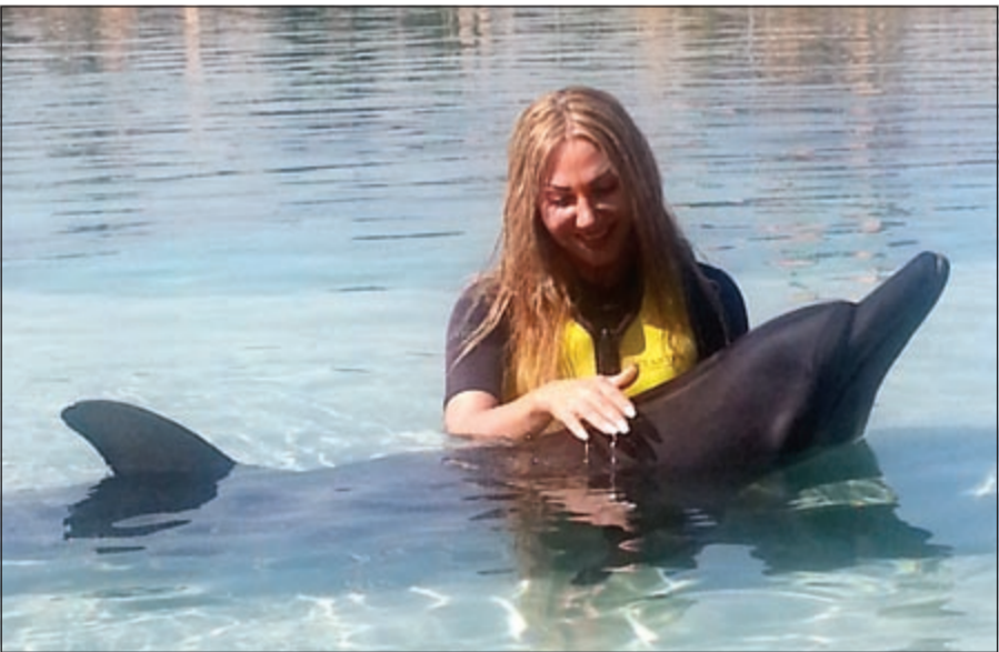
نجوى سلطان ومغامرتها

أقوى المغامرات وأكثر التجارب تشويقا عاشتها النجمة نجوى سلطان برفقة الممثل ومقدم البرامج وسام صباغ أثناء تصوير حلقة خاصة واستثنائية بامتياز من برنامج «خدني معك»، وذلك في دولة الإمارات العربية المتحدة.