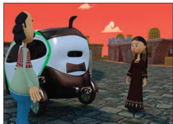
مشهد من المسلسل