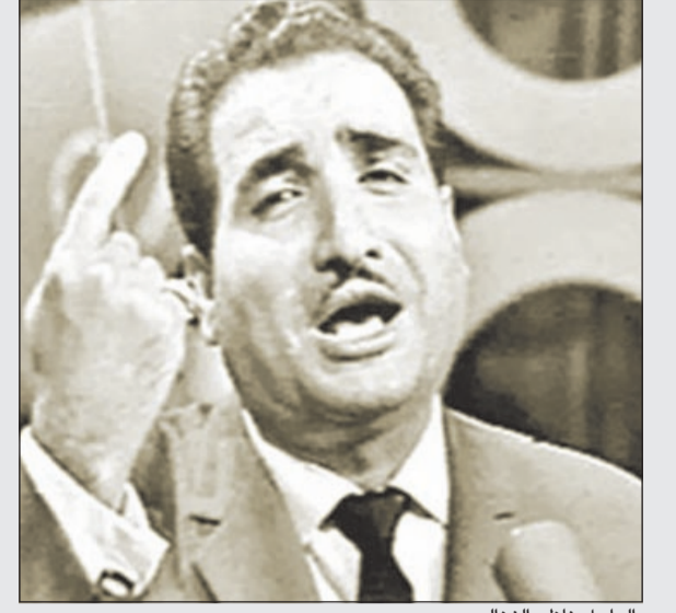
الراحل ناظم الغزالي

تاريخ الاغاني التي تغنى في حلقات البرنامج حفاظا على الحقوق الادبية والفكرية لطربيبها الاصليين حتى وان غادروا دنيانا ليكون في اعدادهم بعض الانصاف لهم حتى لا يقووا في اخطاء قد تقلل من نجاح البرنامج.