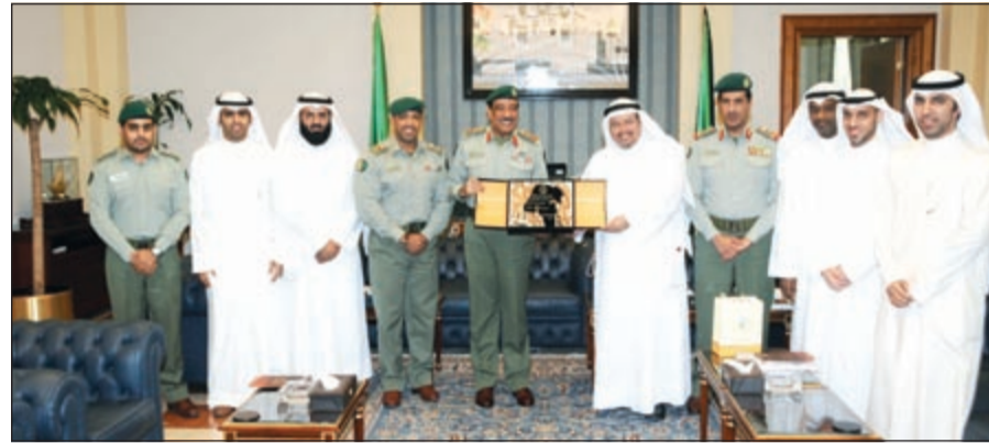
تبادل الدروع التذكارية