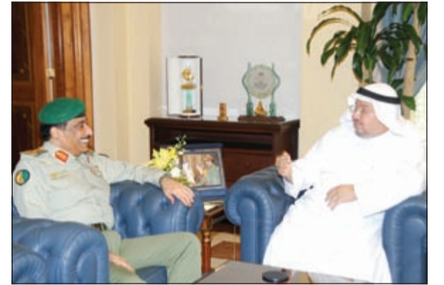
الفريق ناصر الدعي خلال لقائه مع د.عادل الفلاح

ووفاء لكويت العطاء، التي نجحت في تأهيل الشباب في مجالات متنوعة، مشيراً الى التعاون مع وزارة الاوقاف لعقد دورات شرعية لشباب الكويت ضمن مبادرات الحرس الوطني لاداء مسؤولياته الاجتماعية تجاه المجتمع. كما تناول مدير مديرية القوى البشرية المقدم احمد الدعي معايير القبول في الحرس الوطني التي تراعي مبدأ تحقيق العدالة والشفافية، مبيناً الجهود التي تقوم بها المديرية لاستقطاب الكفاءات الى صفوف الحرس الوطني من خلال التواصل مع الشباب في الجامعات والمعارض والمنتديات.