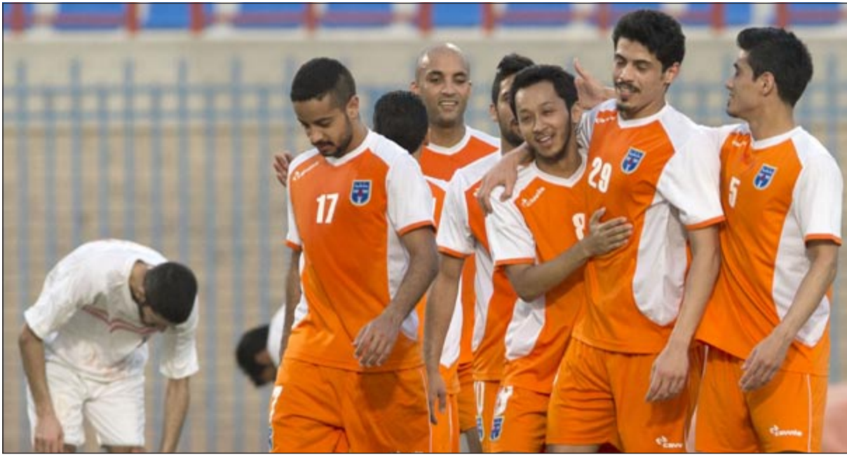
آمال لاعبي كاظمة لانقاذ موسمهم معلقة على احراز لقب كأس الأمير