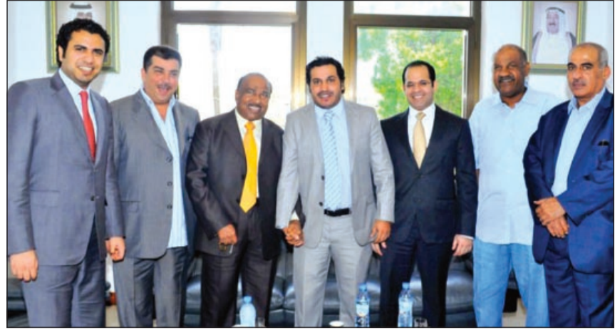
شيخ المعلقين خالد الحربان مع جمال الكاطمي وعدد من الرياضيين الجزائريين

يوسف وعديّة لـ «كونا» ان الحربان من المعلقين القلائل في العالم العربي الذين استحوذوا على قلوب العرب والجزائريين. وقال وعديّة ان الحربان استطاع ببساطته التعامل مع المباراة والتعليق عليها كأن المستمع يقرأ قصة مدتها 90 دقيقة.