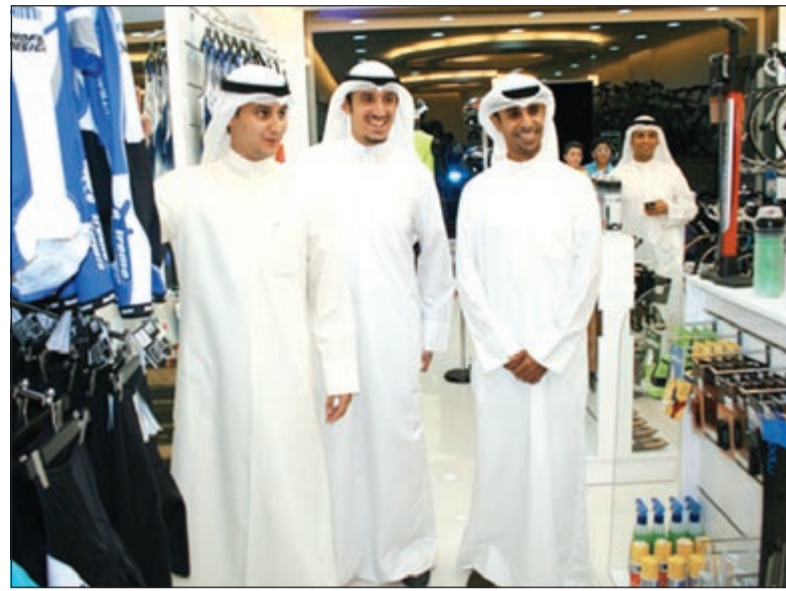
جولة في فرع إكستريم سبورت بالمنقف

وإعداداً لمزيد من المعدات والمستلزمات الرياضية الخاصة بالمشغل التحدي ورياضات التحمل ذات الجودة العالية والتي تلاقي طموحات عملاء إكستريم سبورتس. تمتلك سلسلة متاجر إكستريم سبورتس مجموعة Sports فروعا أخرى في السامية ومجمع التلال في الشويخ بالإضافة إلى فرع المنقف الذي افتتح مؤخرا.