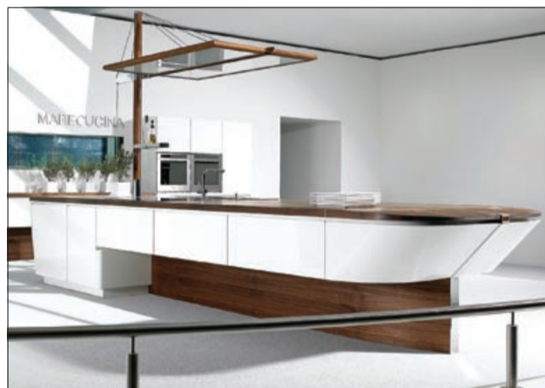
مطبخ خشبي من مطابخ معرفي على شكل سفينة

بمقاسات وأشكال مختلفة يتم اختيارها وفق احتياجات العميل والتصميم الكامل للمطبخ والذي يتم بالتنسيق مع مهندس الديكور المختص والمتواجد في معارض الشركة لتلبية احتياجات العملاء. ويؤكد المطبخ الجديد