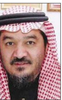
د. توفيق خوجة

أكد مدير عام المكتب التنفيذي لمجلس وزراء الصحة لدول مجلس التعاون البروفيسور توفيق بن أحمد خوجة أن وضع «كورونا» في دول الخليج مطمئن ولا يثير المخاوف، ولم يصل لحالة الوباء، مبيناً أن وزارات الصحة في دول الخليج تطبق كل الإجراءات والتدابير العالمية التي أوصت بها منظمة الصحة العالمية. وكشف في اتصال خاص مع «الأنباء» عن أن هناك تنسيقاً ومتابعة مستمرة من خلال اللجنة الوطنية العلمية للأمراض المعدية في وزارات الصحة الخليجية والجهات الدولية التي تعاملت مع مرض السارس في السابق وتورنتو وستغافورة وهونغ كونغ وأميركا، بجانب التنسيق مع اللجان الدولية لمنظمة الصحة العالمية على مستوى الإقليم في القاهرة، وعلى مستوى العالم في جنيف، مع متابعة الوضع الحالي وما تم التوصل إليه. وطمّن جهود دول الخليج ممثلة بوزارات الصحة بدول