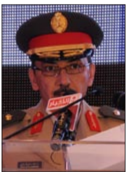
اللواء خالد قباني

في ختام أنشطة الملتقى الدولي الحادي عشر للتشغيل والصيانة في البلدان العربية أعلن اللواء م.خالد بن علي قباني مدير عام الأشغال العسكرية بوزارة الدفاع بالمملكة العربية السعودية أن صاحب السمو الملكي الأمير سلمان بن عبدالعزيز آل سعود ولي العهد نائب رئيس مجلس الوزراء وزير الدفاع قد وافق على إنشاء كرسي لدعم دراسات وأبحاث التشغيل والصيانة في البلدان العربية في المعهد العربي للتشغيل والصيانة وأيضا الموافقة على أن يحمل الكرسي اسم سموه الكريم وتمويله. وفي تصريح لرئيس مجلس إدارة المعهد العربي للتشغيل والصيانة د.محمد الفوزان خلال المؤتمر الصحفي الذي عقده مجلس إدارة المعهد أوضح أن سمو الأمير سلمان قد وجه بتخصيص مبلغ 5 ملايين ريال سعودي لتمويل برنامج الكرسي، وأضاف د.زهير السراج نائب رئيس مجلس المعهد أن الكرسي يهدف إلى المساهمة في إيجاد حلول تطبيقية ومتقدمة وفاعلة في قطاع التشغيل والصيانة في مختلف مرافق الوطن العربي، والمشاركة الفعالة في مسيرة البحث العلمي والدراسات ودعم التنمية المستدامة