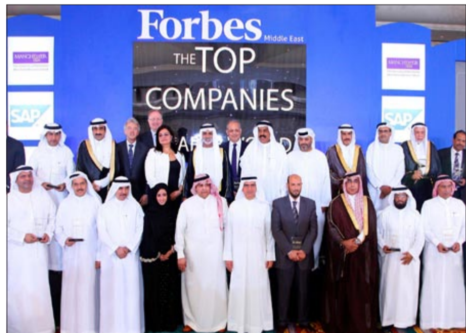
لقطة جماعية لتوزيع الجوائز

العراق بصلة إلى 27 مليار دولار، لتحل الشركات الإماراتية ثانيا من خلال 87 شركة، بأصول بلغت 548 مليار دولار وأرباح بلغت 12 مليار دولار. كما حلت الأردن في المركز الثالث بـ 75 شركة قدرت أصولها بـ 89,4 مليار دولار، وأرباح بلغت 1,65 مليار دولار، لتليها عمان، الكويت، قطر، مصر، البحرين، لبنان، وأخيرا