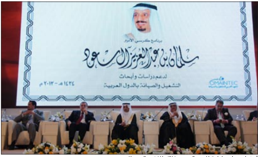
أعضاء مجلس إدارة المعهد العربي خلال المؤتمر الصحفي