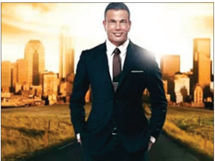
غلاف ألبوم عمرو دياب الجديد