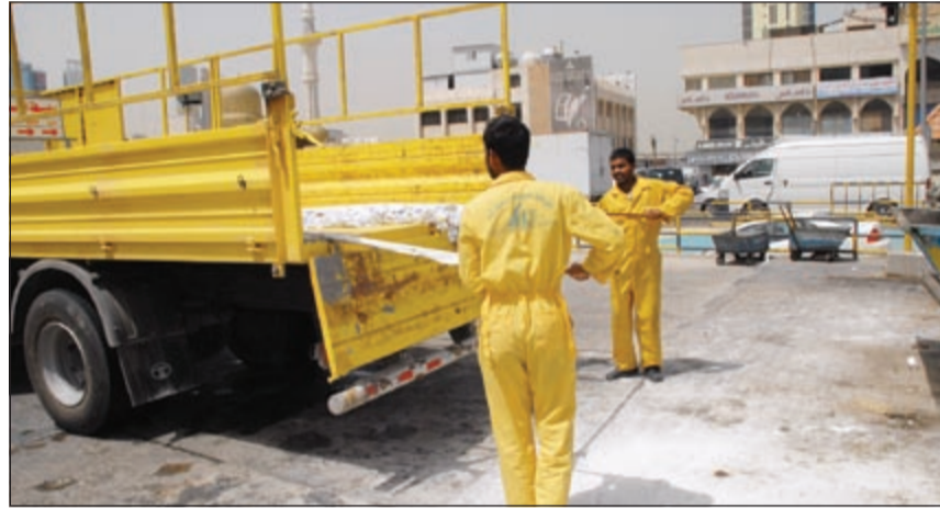
إزالة إعلان مخالف