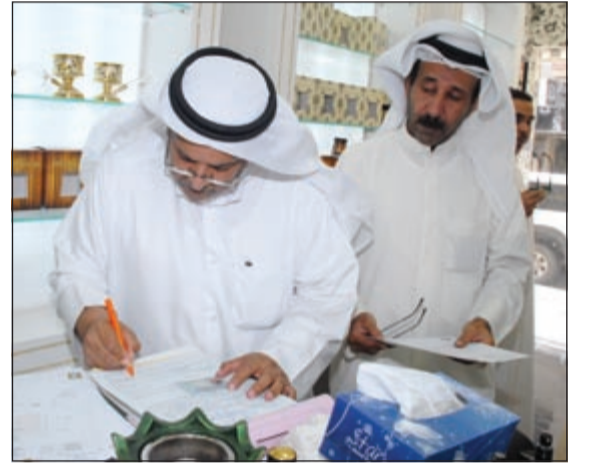
تحرير مخالفة بحق أحد المحلات