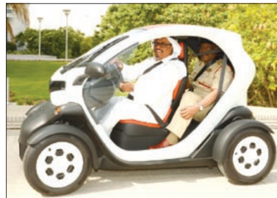
الفريق ضاحي خلفان يقود السيارة الصديقة للبيئة

الصديقة للبيئة للخدمة في الدوريات المرورية يأتي انطلاقا من أهمية الاعتماد والاستخدام المستدام لجميع أشكال الطاقة المتجددة وخفض نسبة الانبعاثات الكربونية وكل المخلفات والانبعاثات السامة والضارة بالبيئة، وتحسين مستويات الصحة المهنية والسلامة العامة واستخدام التقنيات اللازمة للحد من مستويات الضجيج الناجمة عن وسائط النقل.