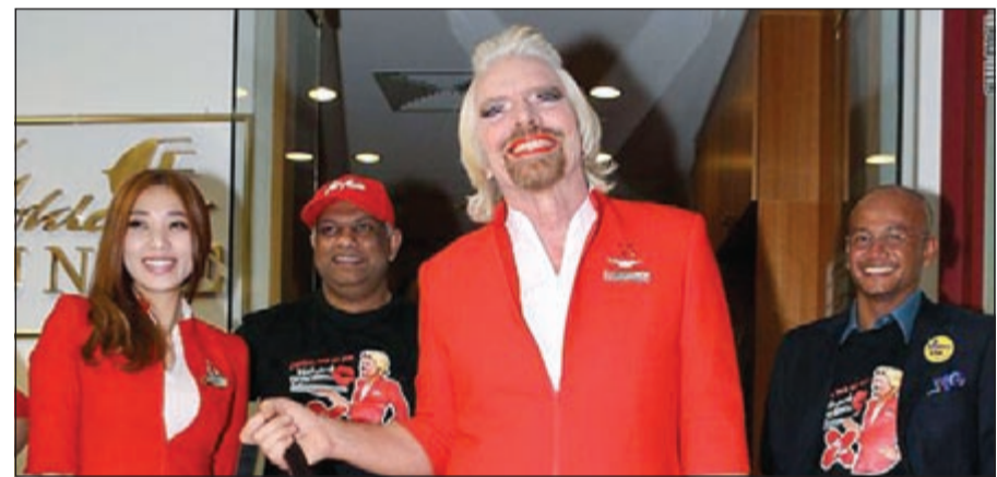
ريتشارد برانسون في زي «مضيفة»

اتلقتا - سسي ان ان: عمل سير ريتشارد برانسون، مؤسس «مجموعة فيرجين» على خدمة وراحة المسافرين كـ «مضيفة»، زهاء خمس ساعات، على متن رحلة جوية بعد خسارته رهانا. وارثدى برانسون زي المضيفة وأحمر الشفاه، وخدم المسافرين على متن رحلة لطيران «أير آسيا» من مدينة بيرث الأسترالية إلى العاصمة الماليزية كوالالمبور. ونجمت الواقعة عن خسارة مؤسس «مجموعة فيرجين»، أسام توني فيرناندز، الرئيس التنفيذي لشركة «أير آسيا» على سباق سيارات «فورمولا 1»، وكان على الخاسر العمل كمضيفة برحلة خاصة والتبرع بعائذاتها لصالح مؤسسة خيرية.