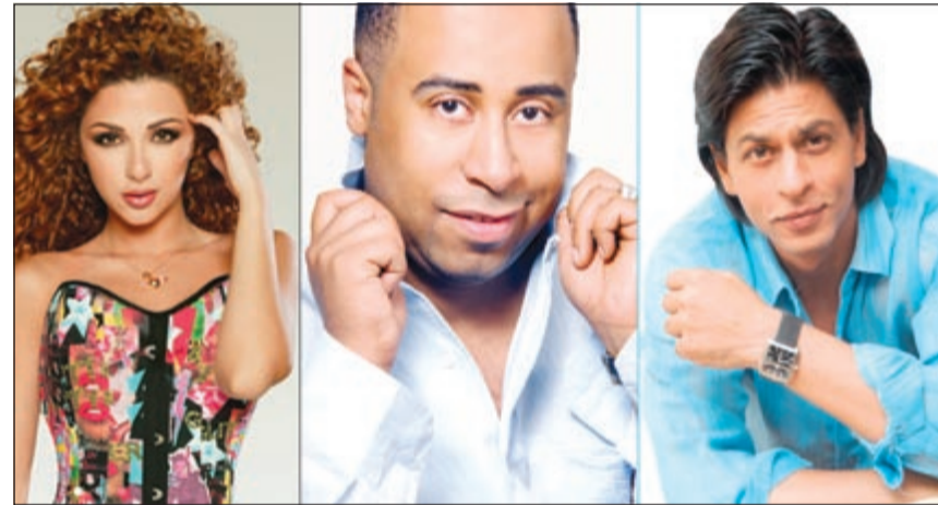
شاروخان والعماني وميريام

بالغناء وبعض الفقرات المضحكة «ستاند أب كوميدى» وهو يمزح