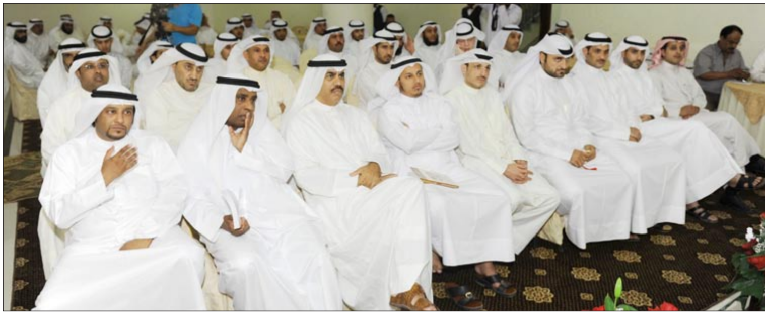
مشاركة كبيرة من التعاونيين في ندوة «قانون التعاونيات وتهميش دور العمل التعاوني»