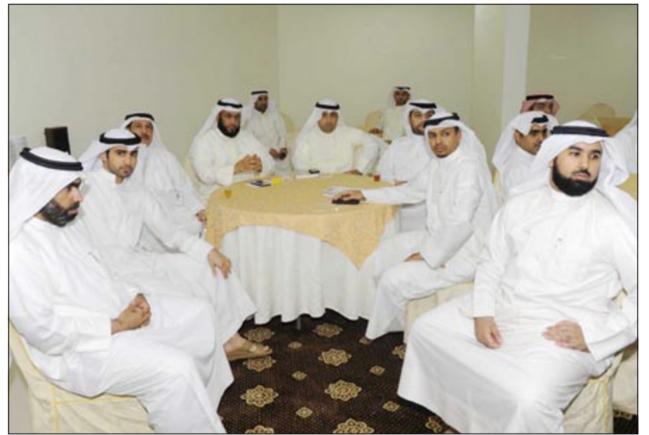
عدد من المشاركين في الندوة

خلال ندوة «قانون التعاونيات وتهميش دور العمل التعاوني» في ديوان العذاب.. بمشاركة عدد كبير من أهل الاختصاص