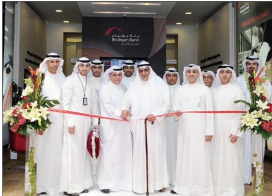
الفليح والماجد وقيادات البنك في افتتاح الفرع الجديد

وأضاف ان أبرز ما يميز الفرع الجديد انه متواصل مع عملائه وغيرهم طوال عطلة نهاية الاسبوع (الجمعة والسبت) للرد على استفساراتهم والاجابة عن جميع تساؤلاتهم التي تتعلق بمنتجات وخدمات البنك. وقد تم تزويد الفرع الجديد بأحدث التقنيات والخدمات التي تمنح العملاء المزيد من الراحة والخصوصية حيث تتوافر في الفرع مختلف الخدمات والمنتجات التي تهم العملاء.