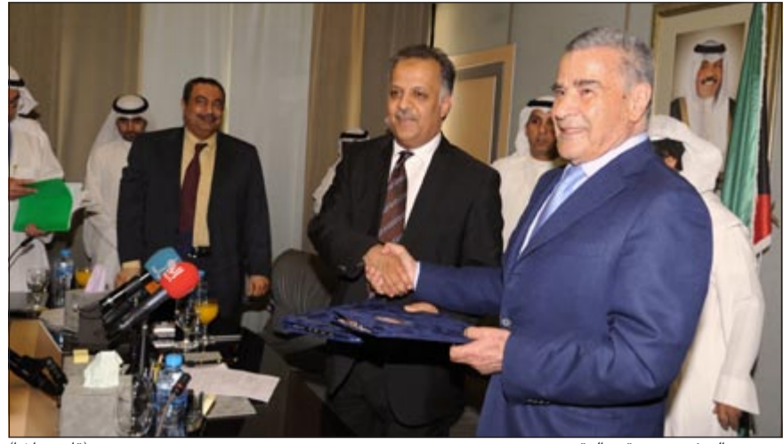
د.محمد الهيئي بعد توقيع العقد (قاسم باشا)

أعلن وزير الصحة د.محمد الهيئي عن توقيع عقد إنشاء برج الأميري خلال مؤتمر صحافي عقد بمقر الوزارة ظهر أمس لتوقيع العقد مع الشركة المنفذة «اسكو» مبينا أن الهدف من إنشاء وتطوير الجباني الصحية هو تقديم خدمة صحية أفضل لكل من يعيش على أرض الكويت.