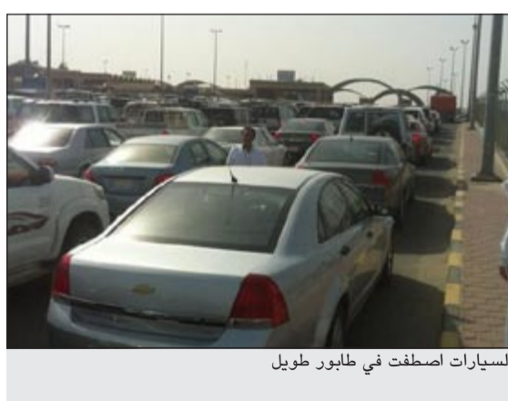
السيارات اصطفت في طابور طويل

من جهة أخرى وضمن إستراتيجية وزارة الداخلية وجهودها المستمرة لحفظ الأمن وتأكيد الأمان في ربوع