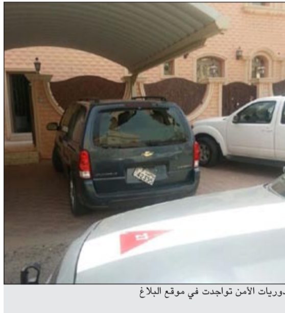
دوريات الأمن تواجدت في موقع البلاغ

وحسب مصدر أمني فإنه وأثناء عمل نقطة تفتيش في منطقة الرقة رجع ريد رجال الحملة صاحب مركبة أميركية يتعمد الهروب من