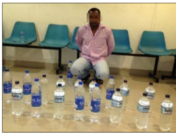
الخمر المضبوطة في حملة الأحمدى

البلاد وفي إطار الإجراءات والمهام الأمنية المكثفة التي يضطلع بها رجال الأمن بقطاع الأمن العام بالتعاون مع أجهزة الوزارة ذات الصلة، قام قطاع