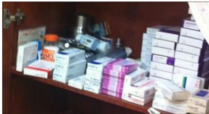
كمية من الأدوية التي تم ضبطها

أو الصحّة، ويستغلّه كعبادة طبية لعلاج الأمراض الجلدية والتجميل وتخسيس الوزن بالمخالفة للجسيمة لقانون مزاولة مهنة الصيدلة. وأكد أن الصيدلي الوافد تمكن من خلال إعلانات قام بنشرها في إحدى مجلات ترويجها الإعلانية التي توزع مجاناً من جذب عدد كبير من الزبائن مواطنين ومقيمين وخليجيين معظمهم من النساء، لافتاً إلى أنه تم ضبط جهاز داخل المحل لقياس الضغط ونسبة الدهون في الجسم والوزن، بالإضافة إلى بروتينات حول برامج تخسيس الوزن الذي يقدمها للزبائن، وكذلك تم ضبط كميات من الأدوية والكريمات والدهانات المتنوعة وأدوية للتغلب على سرعة القذف.