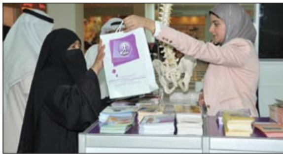
رؤساء الأقيون يستفسرون من فريق ابن سينا