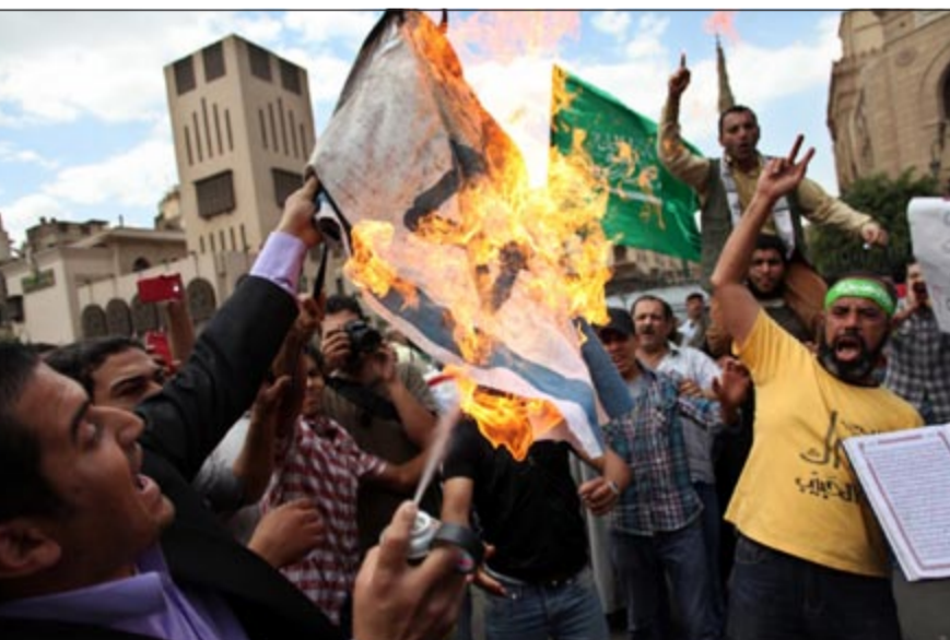
متظاهرون يحرقون العلم الإسرائيلي خلال جمعة «نصرة الأقصى» أمام الأزهر امس

والاعتصامات خلال الفترة الأخيرة. مديانيا، تظاهر آلاف المصريين، عقب صلاة الجمعة أمس منطلقين من أمام الجامع الأزهر، في مسيرة حاشدة منددين باقتحام المسجد الأقصى واعتقال مفتي القدس على يد القوات الإسرائيلية، واستمرار أعمال العنف ضد الشعبين الفلسطيني والسوري، جاء ذلك خلال تظاهرة جمعة «نصرة الأقصى»، التي دعت لها جماعة الإخوان المسلمين، للتنديد باقتحام المسجد الأقصى بالقدس الشريف. ورفع المتظاهرون أعلام مصر وفلسطين وصورا للمسجد الأقصى وقبة الصخرة، وللشيخ عمر عبد الرحمن الزعيم الروحي للجماعة الإسلامية في مصر والمعتقل حاليا بالولايات المتحدة، مطالبين بإطلاق سراحه.