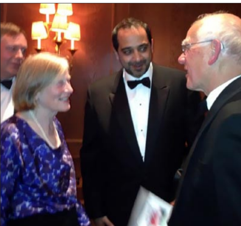
الشيخ محمد العبدالله مع بعض المشاركين في الحفل