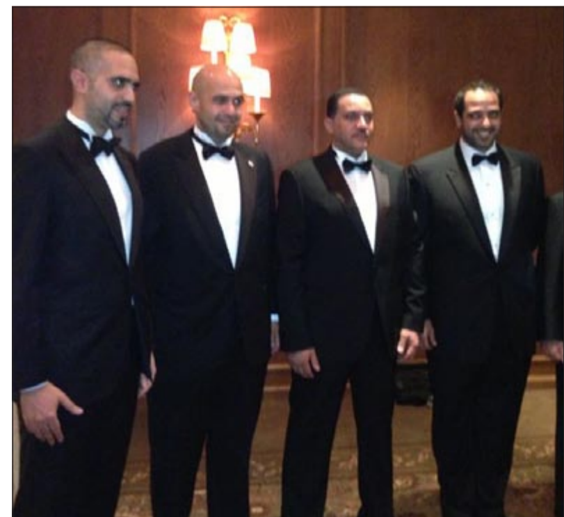
الوزراء أئس الصالح والشيخ محمد العبدالله وم. سالم الأذينة خلال الحفل

كما أكد الشيخ محمد العبدالله نجاح زيارة الوفد الوزاري المكون من وزراء البلدية والمواصلات والإسكان والتجارة الى العاصمة البريطانية لندن. وقال الشيخ محمد العبدالله في تصريح قبيل مغادرة الوفد مطار لوتن (شمال لندن) ان الوفد قدم لرجال الأعمال البريطانيين تصوراً للمشاريع التي تعتمزم في المستقبل وإمكانية إشراك الاجنبي فيها وفقاً لقانون الخصخصة. وأشار الشيخ محمد الى وجود رغبة من الجانب البريطاني في استكشاف الفرص الاستثمارية المتاحة في الكويت لاسيما عقب التشريعات الاخيرة التي اقرتها الحكومة.