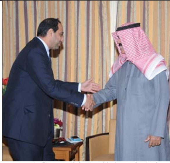
سمو ولي العهد الشيخ نواف الأحمد مرحباً بالشيخ محمد العبدالله