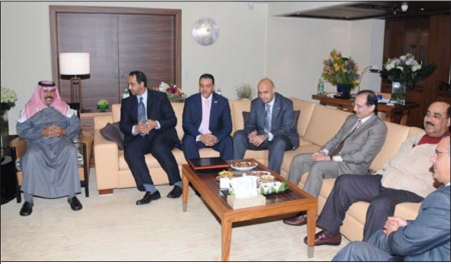
سمو ولي العهد الشيخ نواف الأحمد مستقبلاً الوزراء الشيخ محمد العبدالله وأئس الصالح وم. سالم الأذينة بحضور الشيخ مشعل الأحمد والسفير مساعد الهارون