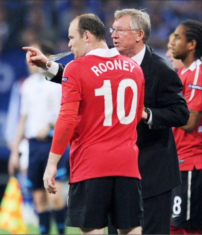
فيرغسون موجها روني خلال إحدى مباريات يونايتد

من فيرجسون قبل أسبوعين الانتقال من يونايتد، رغم أنه بعد رفض هذا الطلب غير الرسمي لم يتقدم اللاعب بأي طلبات رسمية لناديه.