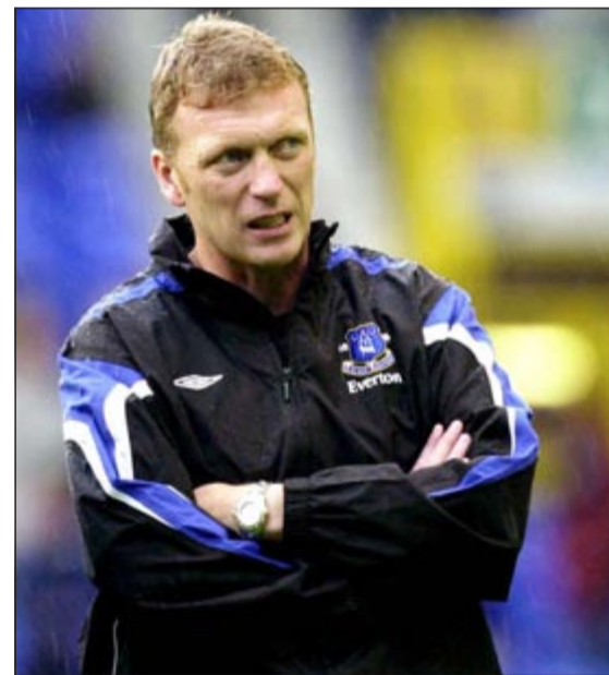
ديفيد مويس سيقدو مان يونايتد ابتداء من 1 يونيو المقبل