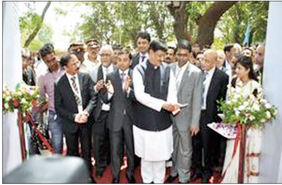
رئيس وزراء ولاية ماهاراشترا الهندي مفتحاً IPHEX 2013