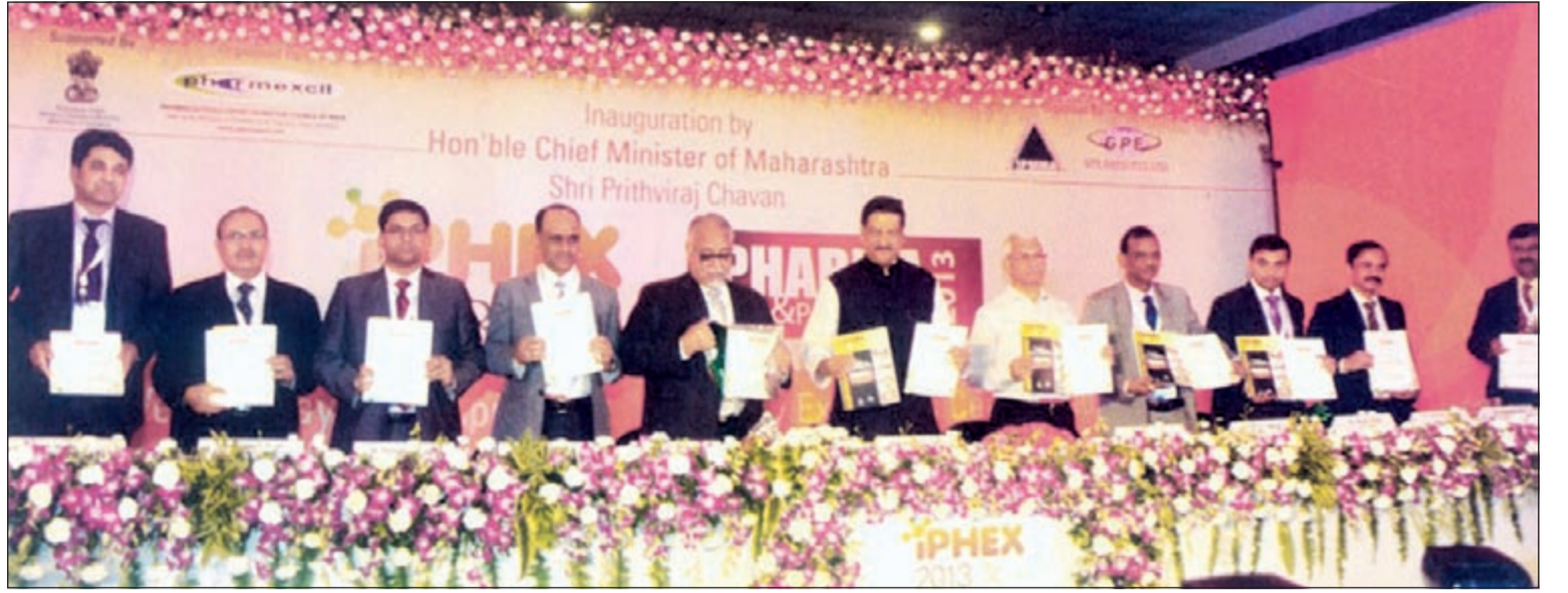
رئيس وزراء ماهاراشترا بريثفيرا شافان متوسلا عددا من المسؤولين عن المعرض في الجلسة الافتتاحية