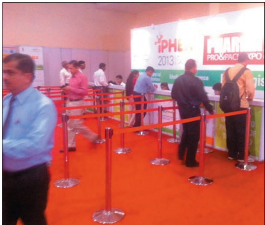
جانب من عملية تسجيل زوار المعرض

أباجي: قمنا بتنظيم مؤتمرات تقنية ليقوم من خلالها متخصصون في الهيئات الرقابية للأدوية بتقديم عروض توضيحية