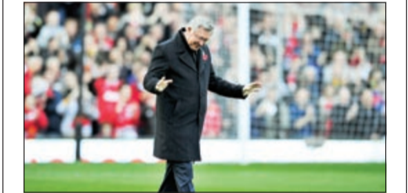
فيرغسون يودع مسرح الاحلام «أولد ترافورد»