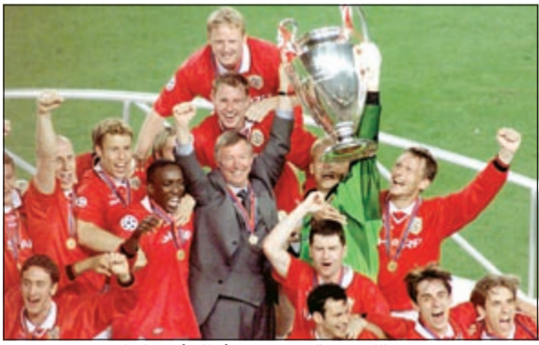
فيرغسون يحتفل مع اللاعبين بالفوز بدوري أبطال أوروبا عام 1999