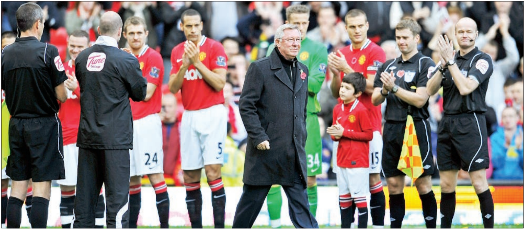
انج مدرب في تاريخ الكرة الإنجليزية فيرغسون يعتزل تدريب مان يونايتد

فيما يلي نبذة عن السير الاسكتلندي اليكس فيرغسون الذي أعلن اعتزاله من تدريب مان يونايتد: ● تاريخ ومكان الولادة: 31 ديسمبر 1941 (71 عاما) غلاسغو. ● الاندية: ايبست ستيرلينغشاير (اغسطس - اكتوبر 1974)، ساينت ميرين (اكتوبر 1974 - ابردين 1978)، ايردين (1978 - 1986)، مهمة مع منتخب اسكتلندا (يوليو - نوفمبر 1986)، مان يونايتد (1986 - مايو 2013). ● أول مباراة له كمدرّب ليونايدي: 1986 أمام أوكسفورد (2-0). ● إنجازاته كمدرّب: دوري أبطال أوروبا (1999 و2008). ● كأس كؤوس أوروبا (1983 و1991) والكأس السوبر (1983 و1991). ● كأس الاتحاد الإنجليزي (1999)، وكأس العالم للاندية (2008). ● بطولة إنجلترا (13 مرة) أعوام 1993 و1994 و1996 و1997 و1999-2001 و2003 و2007 و2008 و2010 و2011 و2013). ● كأس إنجلترا (5 مرات) أعوام 1990 و1994 و1996 و1999 و2004). ● كأس الرابطة (4 مرات) أعوام 1992 و2006 و2009 و2010). ● درج المجتمع (10 مرات) أعوام 1990 مناصفة و1993 و1994 و1996 و1997 و2003 و2007 و2008 و2010 و2011). ● جوائز: أفضل مدرب في إنجلترا (10 مرات) وأفضل مدرب في أوروبا (1999).