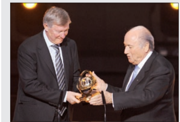
بلاير يقدم إحدى الجوائز لفيرغسون

معرفته الرائعة مع الجيل الجديد من المدربين الحاليين بإعادة إنتاج نجاحاته في هذه الرياضة». ديفيد كامبيرون (رئيس وزراء بريطانيا): «ما حققه السير اليكس فيرغسون مع يونايتد كان استثنائيا. أمل أن يسهل رحيله حياة فريقين (استون فيلا)». كريستيانو رونالدو (لاعب يونايتد السابق): «شكرا جزيلاً على كل شيء أيها القائد». الدنماركي بيتر شمايكل (حارس مرمى يونايتد السابق): «كنت أعرف أن هذا اليوم سيأتي، لكن بصراحة اعتقد انه مازال مبكرا. كان يمكنه الاستمرار لسنة أو سنتين، فوجئت وحزنت أيضا».