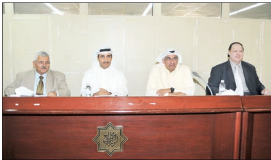
الجاهمة مترئسا الجمعية العمومية لـ الراي الاعلامية.

ولفت بوذي في تقريره الى ان المجموعة استمرت من خلال شركة الراي للإنتاج إحدى شركات المجموعة بتبوء مركز مرموق في إنتاج وتوزيع الدراما التلفزيونية (الخليجية) بوجه خاص نظراً للتميز في جميع الأعمال الدرامية التي تقوم بإنتاجها، وذلك بفضل الخبرات الكبيرة لدى المسؤولين عن الإنتاج بالشركة، وبالإضافة الى استمرار شركة الناشر للطباعة إحدى شركات