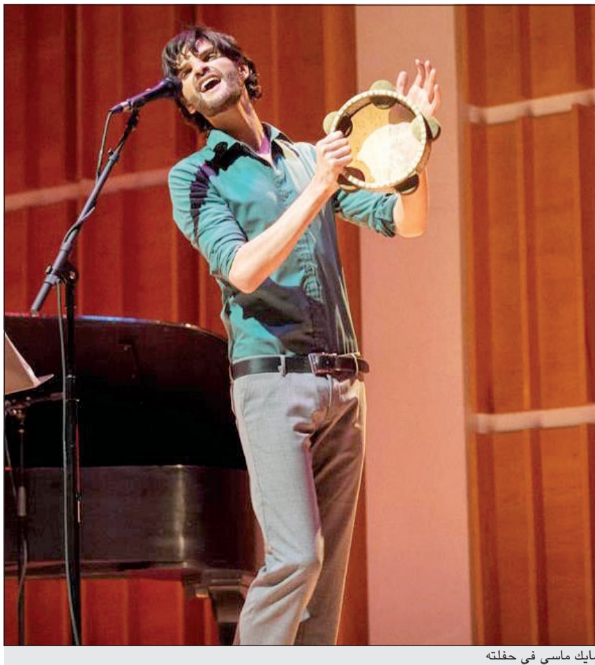
مايك ماسي في حفلة

سلسلة نجاحات متتالية تشهد عليها 3 كليبات مميزة كانت وليدة التوأمة المتناغمة بين الفنان سعد رمضان والمخرجة سيلفانا المولى. وما هو ينتهي سعد من تصوير كليبه الرابع مع سيلفانا، لأغنيته «البيت اللبناني»، وهي أغنية لبنانية شعبية، كلمات بيير حايك، ألحان ياسر جلال، وتوزيع روجيه خوري وإنتاج مولي بروكشون. تعود أحداث الكليب الى فترة الأربعينيات، حيث يتم اختطاف شقيقة سعد، وسنرى كيف يمكن ان يتصرف الشاب صاحب الشيم والأخلاق اللبنانية في موقف مماثل. يذكر انه تم اختيار سعد من قبل شركة لوكس العالمية، لاداء أغنية «أهواك» للراحل عبدالحميد حافظ بصوته، للترويج لأحد منتجاتها عبر