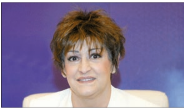
الراحلة وردة الجزائرية