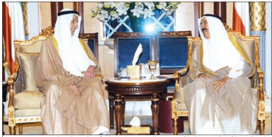
صاحب السمو الأمير الشيخ صباح الأحمد مستقبلاً رئيس ديوان المحاسبة عبدالعزيز العبدساني

الى ذلك هنا مدير عام مؤسسة الموائى الكويتية الشيخ د.صباح جابر العلي صاحب السمو الأمير الشيخ صباح الأحمد وسمو ولي العهد الشيخ نواف الأحمد والكويت واهلها وشعبها بمناسبة نجاح العملية الجراحية التي أجريت لسمو ولي العهد الشيخ نواف الأحمد وتكلمت بالنجاح. وتنى الشيخ جابر العلي لسمو ولي العهد موفور الصحة والعافية، داعياً الله العلي القدير ان يحفظه وان يسبغ عليه نعمة الصحة والعافية وأن يعود سموه الى البلاد سالماً معافى ولتتم فرحة شعب الكويت بشفاؤه وليواصل سموه