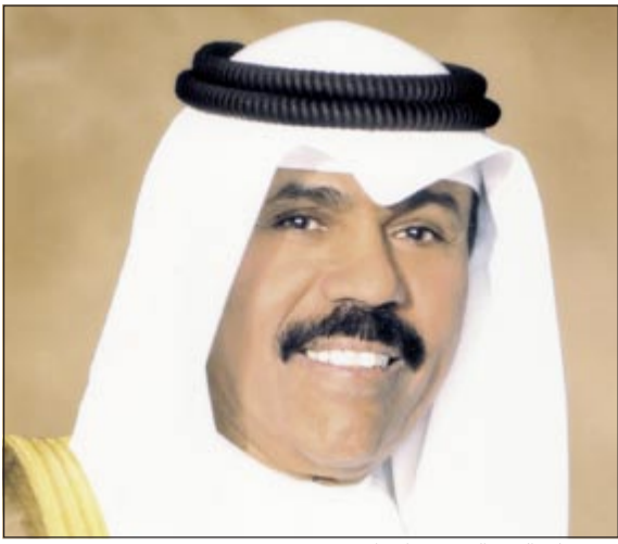
سمو ولي العهد الشيخ نواف الاحمد

واضاف: عرف الكويتيون في سموه اللين في التعامل والحزم الشديد في الحق فأصبح اسم سموه لديهم حكماً لا يقبل الطعن او النقض او الاستئناف لأنه قرار نهائي صحيح ومدروس يضع مصلحة الكويت وانباء الكويت فوق كل اعتبار مهما كانت الظروف. واختتم العلي بالقول ندعو الله جل وعلا ان يحفظ الكويت واهلها في ظل القيادة الحكيمة لصاحب السمو الأمير وسمو ولي العهد وسمو رئيس الوزراء وفقهم الله ورعاهم وسدد على طريق الخير خطاهم واسبغ عليهم ثوب الصحة والعافية لقيادة الكويت الى المستقبل الذي يتمناه ابناء الكويت الأوفياء ويطمحون اليه.