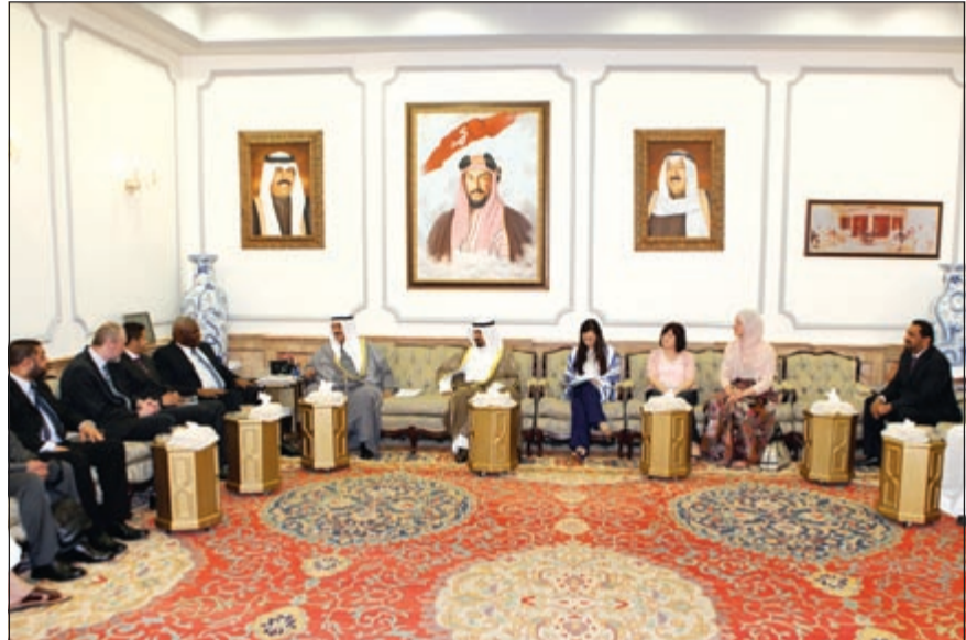
سمو الشيخ ناصر المحمد مستقبلاً محافظ شيفيلد المستشار جون كامبل

استقبل سمو الشيخ ناصر المحمد في قصر الشويخ أمس بحضور محافظ العاصمة الشيخ علي الجابر محافظ شيفيلد بالملكة المتحدة الصديقة المستشار جون كامبل، والوفد المرافق له، بمناسبة زيارته للبلاد. كما استقبل سموه استاذ العلوم السياسية في جامعة الامارات بدولة الامارات العربية المتحدة الشقيقة د.عبدالخالق عبدالله ورئيس تحرير صحيفة قطر تربيون بدولة قطر الشقيقة د.حسن الانصاري بمناسبة زيارتهما للبلاد. واستقبل سموه رئيس المركز الإسلامي لمدينة رانس بالجمهورية الفرنسية الصديقة عبدالكبير قطبي والوفد المرافق له بمناسبة زيارته للبلاد.