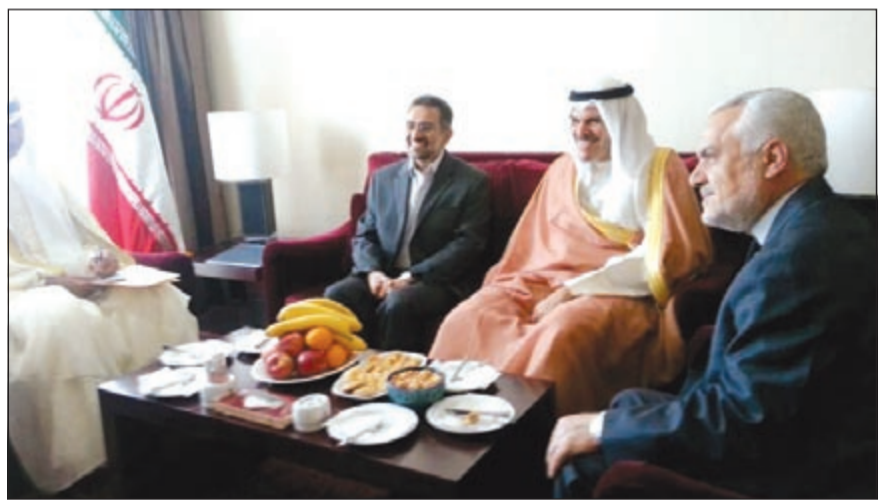
الشيخ سلمان الحمود أثناء لقائه نائب الرئيس الإيراني محمد رضا رحيمي

صاحب السمو الأمير الشيخ صباح الأحمد الى رئيس الجمهورية الإسلامية الإيرانية والقيادة السياسية والشعب الإيراني الكريم على الدور الذي تلعبه في خدمة شعوب القارة الآسيوية ودعم التنمية في المشاريع الإنسانية.