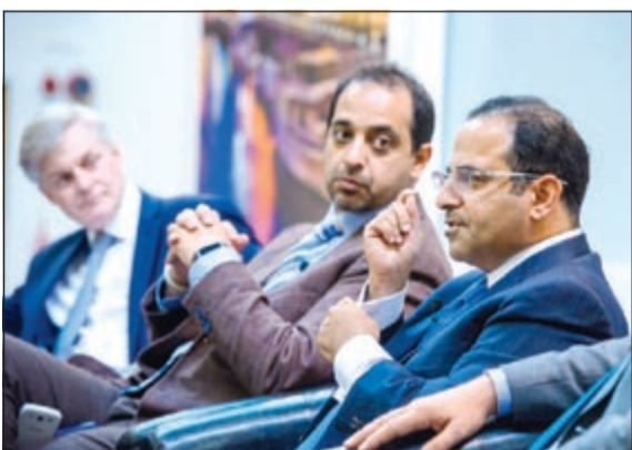
الشيخ محمد العبدالله خلال مشاركته في أعمال المؤتمر

وقال الصالح في تصريح لوكالة الانباء الكويتية (كونا) على هامش مشاركته في «مؤتمر الفرص الاستثمارية في الكويت» والذي تعقد أعماله بالتعاون مع الحكومة البريطانية ان الكويت وبتجربتها الديموقراطية العريقة والطويلة في المنطقة من أكثر الدول اماناً من حيث الاستثمار رغم القيود في بعض التشريعات التي تعمل الحكومة ومجلس الأمة حالياً على تعديلها. وردا على سؤال لـ «كونا» حول تخصيص القطاعات الحيوية في الكويت أكد الوزير الصالح جدية الحكومة في تنفيذ مشروع خصخصة عدد من القطاعات الحكومية كالكهرباء والماء والاتصالات للوصول الى خدمة أفضل تقدم للمواطن والمقيم علاوة على خلق فرص عمل جديدة.