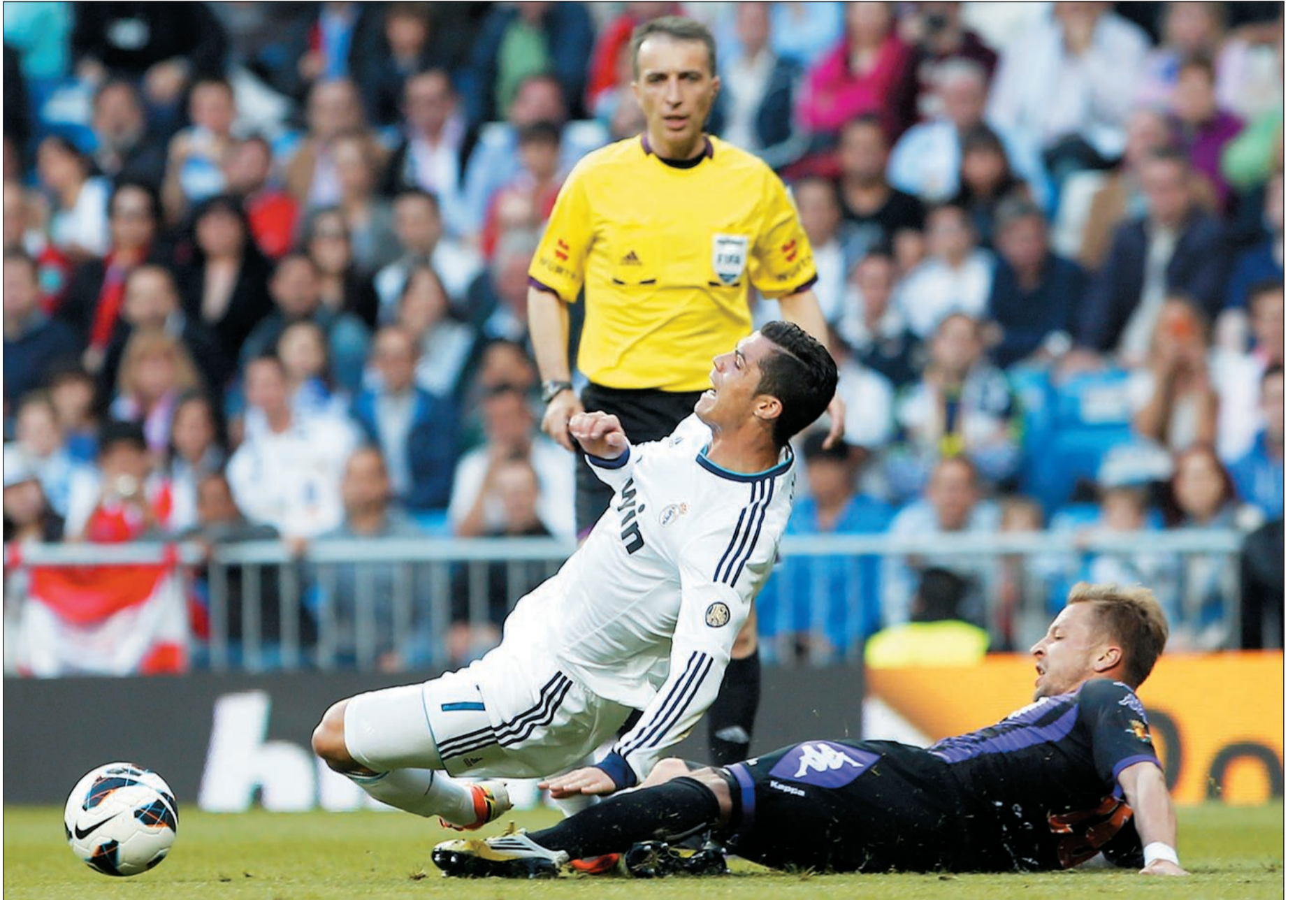
تجم ريال مدريد كريستيانو رونالدو يخشى التعثر اليوم امام ملقة