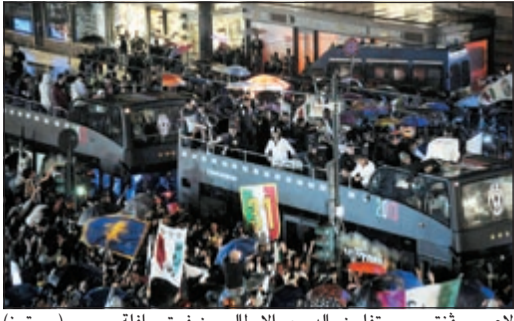
لاعب يوفنتوس يحتفلون بالدوري الإيطالي من فوق حافلة

أكد يوفنتوس انه استعداد مكانته في الكرة الإيطالية بعد أن نجح في حسم لقب الدوري المحلي للمرة الثانية على التوالي والتاسعة والعشرين في تاريخه، وذلك قبل ثلاث مراحل على انتهاء الموسم. لقد وضع «بياتكونيري» خلفه الكابوس الذي اختبره في منتصف العقد الماضي حين جرد من لقب عامي 2005 و2006 بسبب تورطه في فضيحة التلاعب بالنتائج وإنزاله الى الدرجة الثانية عام 2006 ما اثر على مستواه بعد عودته في الموسم التالي بين الكبار بسبب رحيل عدد كبير من نجومه. اكتفى يوفنتوس بلعب دور المتفرج بعد عودته الى «سيرى ا»، حيث شاهد انتر ميلان يتوج باللقب خمس مرات متتالية (اللقب الاول عام 2006 ورثه بسبب معاوية يوفنتوس) ثم انتقل اللقب في 2011 الى القطب الأخر لمدينة ميلانو «ميلان»، لكن فريق «السيدة العجوز» بقيادة لاعب وسطه السابق انتونيو كونتي تمكن من نفض غبار «كالتشيو بولي» عنه واحرز اللقب الموسم الماضي للمرة الاولى (رسميا) منذ 2003 ثم اتبعه هذا الموسم بلقب ثان عزز من خلاله موقعه كأكبر الاندية فوزا باللقب (29 مقابل 18 لميلان وجاره انتر ميلان). وبعد ان فرض يوفي سطوته على الدوري يجب ان يفكر الآن بالتمدد قاريا من خلال المنافسة على لقب المسابقة الاعلى اي دوري ابطال أوروبا.