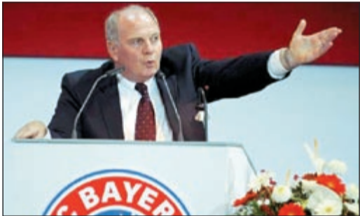
رئيس بايرن ميونخ اولي هونيس

بعد ان تحدى الموت ونجا من حادث سيارة خطير جدا وتحطم طائرة كان فيها، اظهر رئيس بايرن ميونخ الالماني اولي هونيس مجددا غريزة البقاء لديه وقدرته على تجاوز المصاعب وبقي على رأس الادارة الفنية لبطول «يونديسليغا» رغم فضيحة تهريه من دفع الضرائب. وترقت جماهير بايرن ميونخ ما سيخرج عن اجتماع المجلس الاشرافي للنادي البافاري، حيث تقدم هونيس باستقالته بسبب التحقيق الذي فتح معه لاتهامه بالتهرب من الضرائب، لكن المجلس رفض الاستقالة وطلب منه مواصلة مهامه. كان القرار الصادر عن المجلس الاشرافي بمنزلة تجديد الثقة بالرجل البالغ من العمر (61 عاما) والذي اعتقلته الشرطة الشهر الماضي ثم اطلقت سراحه بكفالة مالية قدرها 5 ملايين يورو، وذلك في اطار التحقيق بتهريبه امواله الى مصرف سويسري دون ان يدفع الضرائب عنها، وفي ظل سعي بايرن ميونخ لكي يصبح اول فريق الماني يتوج بثلاثية الدوري والكأس المحليين ونوري ابطال أوروبا حيث سيواجه غريمه المحلي بوروسيا دورتموند في النهائي المقرر في 25 الشهر الجاري على ملعب «ويغلي» في لندن، فان ابقاء هونيس في منصبه سيستمر المزيد من الضجة الاعلامية والسياسية في عام تجرى فيه الانتخابات النيابية تحت عنوان مكافحة التهرب من الضرائب.