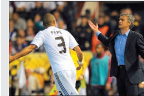
مورينيو يرد على بيبي بحذف

تابع مدرب ريال مدريد، ثاني الدوري الإسباني لكرة القدم البرتغالي جوزيه مورينيو انتقاداته الى لاعبيه عندما أكد أسس ان مشكلة مواطنه قطب الدفاع بيبي تدعى «الفرنسي» رافايل فاران، وجاءت تصريحات مورينيو ردا على تصريحات بيبي التي دافع فيها عن قائد النادي الملكي حارس المرمى ايكر كاسياس الذي استبعده مورينيو عن التشكيلة منذ عودته الى الملاعب في ابريل الماضي. وقال مورينيو في مؤتمر صحفي عشية مواجهة فريقه لخصيفه ملقة في مباراة مقدمة من المرحلة 36 للدوري المحلي: «من السهل جدا تحليل ما يحصل لبيبي، مشكلته تحمل اسم رافايل فاران»، وأضاف «لا تتطلب المسألة نكاه كبيرا لفهم خيبة أمل بيبي. ذلك ليس سهلا على لاعب يبلغ 31 عاما مقارنة مع شاب في التاسعة عشرة من العمر، وهو شاب رائع كانت لدي الشجاعة للدفع به اساسيا، من هنا تغيرت حياة بيبي»، وتلق الدفاع الفرنسي في موسمها الثاني مع النادي الملكي وخطف مركزا أساسيا في التشكيلة على حساب بيبي.