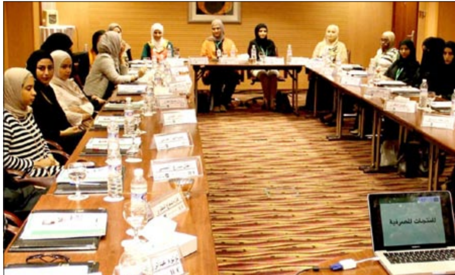
جانبا من الدورة

وتستمر البرامج التدريبية لمدة شهرين بشكل نظري وعملي ومن ثم يتم الطلب من الموظفات المتدربات تقديم مشاريع بالبرامج التي تم التدريب عليها للتأكد من مدى الاستيعاب والقدرة على التطبيق العملي للحصول العلمي، مما يزيد من ثقة ويمنحهن القدرة على مواجهة أسئلة العملاء وتحديات العمل بطريقة سليمة وثيقة مطلقة. ويستعين «بيتك» بمدرسين وخبراء محليين وعالميين وذلك لتنوع مصادر المعلومات وتوسيع طرق ومناهج الأداء التدريبي للاستفادة من الخبرات المحلية والعالمية، كما أن اختيار «بيتك» لهذه الدفعة من المعينات الجدد، جاء بناء على معايير وأسس لتقييم المتقدمين للعمل طبقت بشكل منهجي ودقيق.