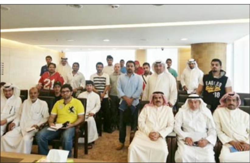
مديرو المحطات لدى الأولى للوقود خلال الدورة التدريبية