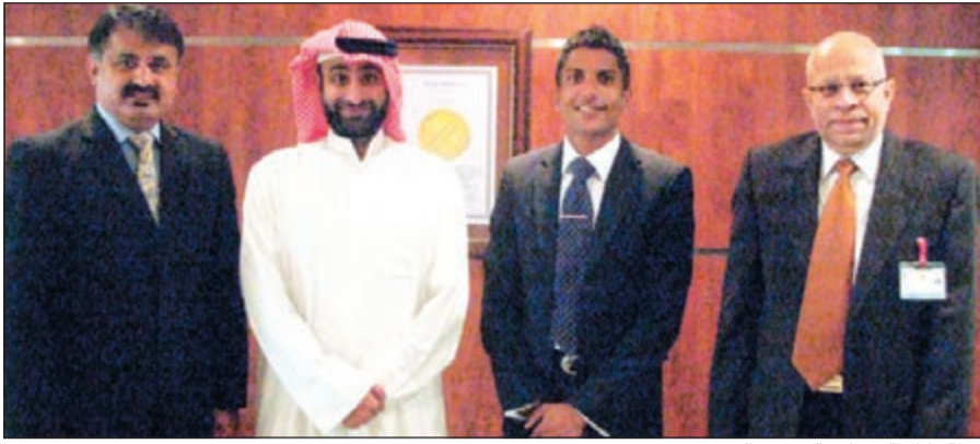
لقطة تذكارية بمناسبة توقيع العقد

له، بأننا نسعى دائماً لاستقطاب أفضل الكوادر الطبية من استشاريين عالميين في مجال الطب والصحة العامة والتجميل والجراحة والمعروفين بخبرتهم العريقة العالمية والأكاديمية في جميع تخصصات الطب المتنوعة، وهذا ينبع من الاستراتيجية الصحية التي يتبناها «مستشفى طبية» والتي تتصف بأنها متكاملة الحدود وترتكز على تطوير الخدمات الصحية بشكل عام وتوفير احتياجات المراجع وفق أحدث ما توصل إليه الطب والعلم الحديث.