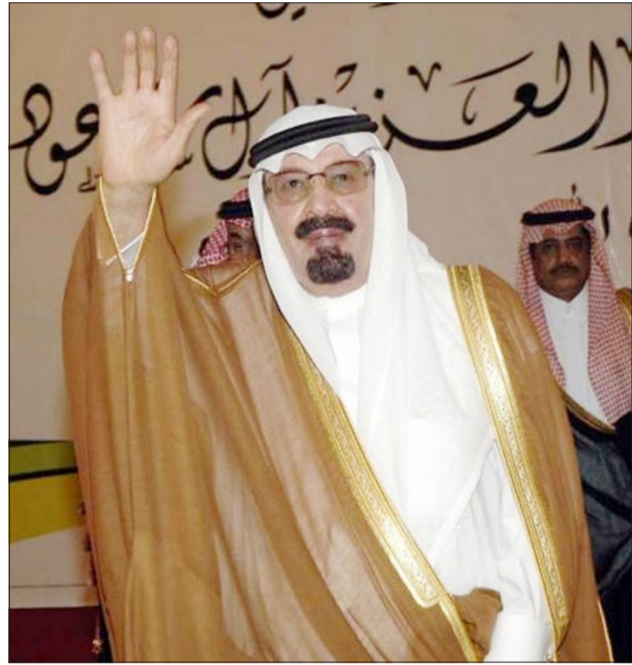
خادم الحرمين الشريفين الملك عبدالله بن عبدالعزيز

احتفل السعوديون أمس بالذكرى الثامنة لمبايعة خادم الحرمين الشريفين الملك عبدالله بن عبدالعزيز وتوليه مقاليد الحكم، ليجسدوا من خلالها الحمة الوطنية مع قاداتهم لمواصلة بناء دولة حضارية متطورة.