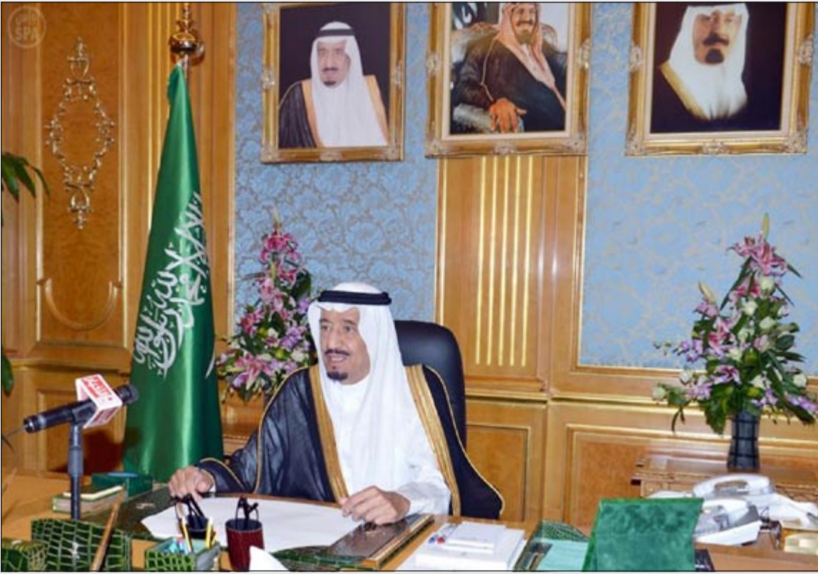
صاحب السمو الملكي الأمير سلمان بن عبدالعزيز ولي العهد نائب رئيس مجلس الوزراء وزير الدفاع (واس)

ولي العهد: نحب خادم الحرمين الشريفين لأنه ملك الوفاء