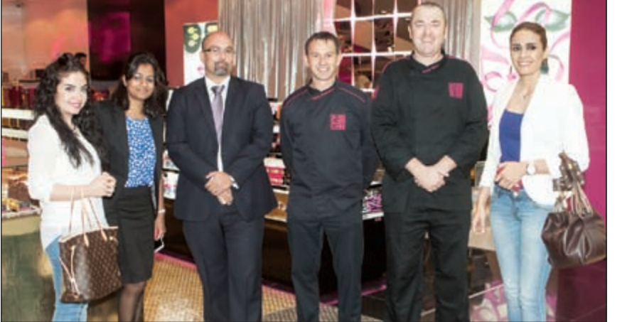
جانب من حفل الافتتاح

منتجات فوشون، ويوفر فرع فوشون الأقيونيوز لعملائه الكرام أفضل المنتجات الطازجة من الفطور والغداء والعشاء بالإضافة إلى الحلويات فوشون الشهيرة مع الإكلير والمكرون اللذيذ. كما يقدم مجموعة واسعة من الحلويات وأصناف مخصصة للذواقة والشاي المعطر والشوكولاته من ضمنها التشكيلة الجديدة «شوكو» «Made in F». هناك المزيد من الأفرع الجديدة مخطط لها في جميع أنحاء الشرق الأوسط مع وجود فوشون في 42 دولة حول العالم، هناك خطط لافتتاح المزيد من الأفرع في الشرق الأوسط خصوصا في سلطنة عمان والبحرين والسعودية. خلال عام 2012/2011 وصلت مبيعات فوشون إلى 169 مليون يورو تم رصد 70٪ من خلال أكثر من 450 منفذ بيع عالمي و51 فرعا من فوشون. مع المستوى العالي من الخدمة في فوشون الكويت استطاع أن يستحوذ على ولاء عملائه الراقيين ويتطلع لمزيد من التوسع داخل الكويت في المستقبل القريب. • يلقيس العلي